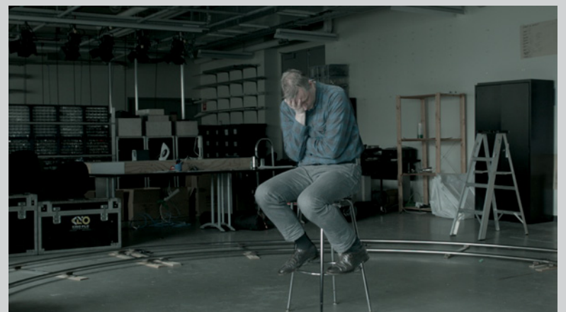
The Act of Forgetting , 2015, images tirées de la vidéo HD