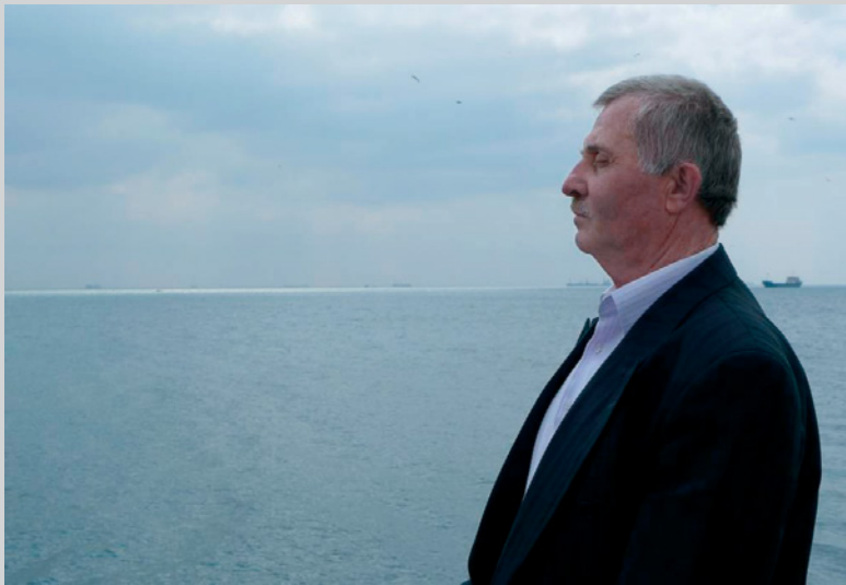
Aveugle au divan (détail), de la série La dernière image , 2010

Calle a mené à la mer des gens – des voyants – qui ne l’avaient jamais vue. Elle a filmé leur première fois.