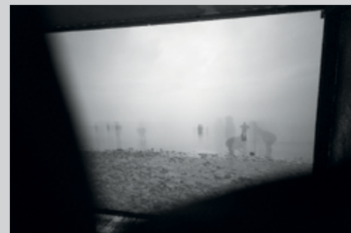
Fin de journée à la plage, Bonaventure, 2014, de la série Projections 2014-2019, impression jet d'encre