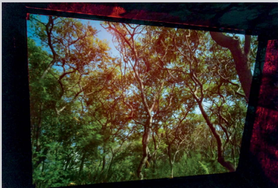
Sous les vinaigriers, Caplan, 2014, de la série Projections 2014-2019, impression jet d'encre, 61 x 91 cm