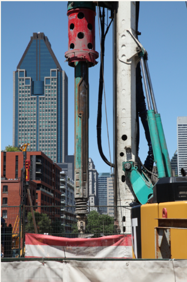
Rue Ottawa, Griffintown, 2018

Griffintown de manière symbolique plutôt que descriptive. Les gravats dans la benne à ordures forment un contraste ironique avec la photo sur le flanc du camion de rénovation. « Fini l'ancien, place au nouveau » pourrait être une légende appropriée.