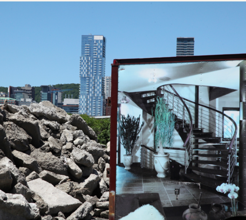
Rue Basin, Griffintown, 2018

JDC: You said you were lukewarm about the project going in. Coming out, how do you feel now?