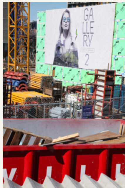
Rue Wellington, Griffintown, 2018