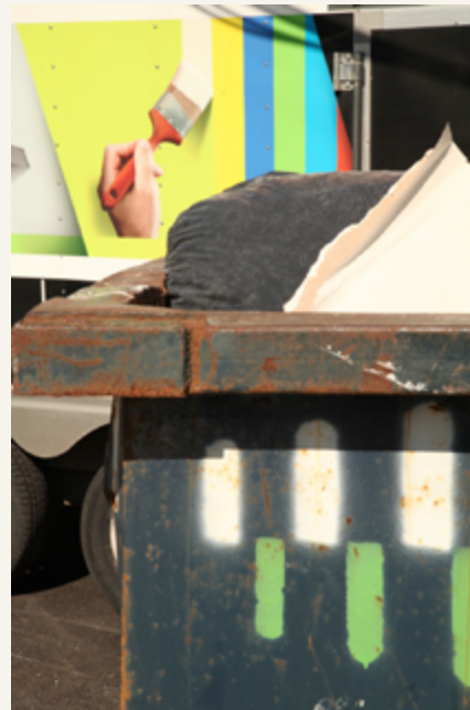
Rue de la Montagne, Griffintown, 2018

RW : Je suis né dans le quartier ouvrier d'Hochelaga-Maisonneuve, qui a aussi subi d'importants bouleversements depuis l'époque où on l'appelait la « Pittsburgh du Nord », donc la sensibilité que je peux avoir à exprimer est transposée là. J'ai eu l'occasion de côtoyer un peu les cochers de calèches et les palefreniers au cours du projet et je compatis à leur détresse. Voilà une industrie qui prospérait depuis des centaines d'années et qui est subitement rayée de la carte sans compensation par un règlement. Il y a là-dedans quelque chose d'arbitraire.