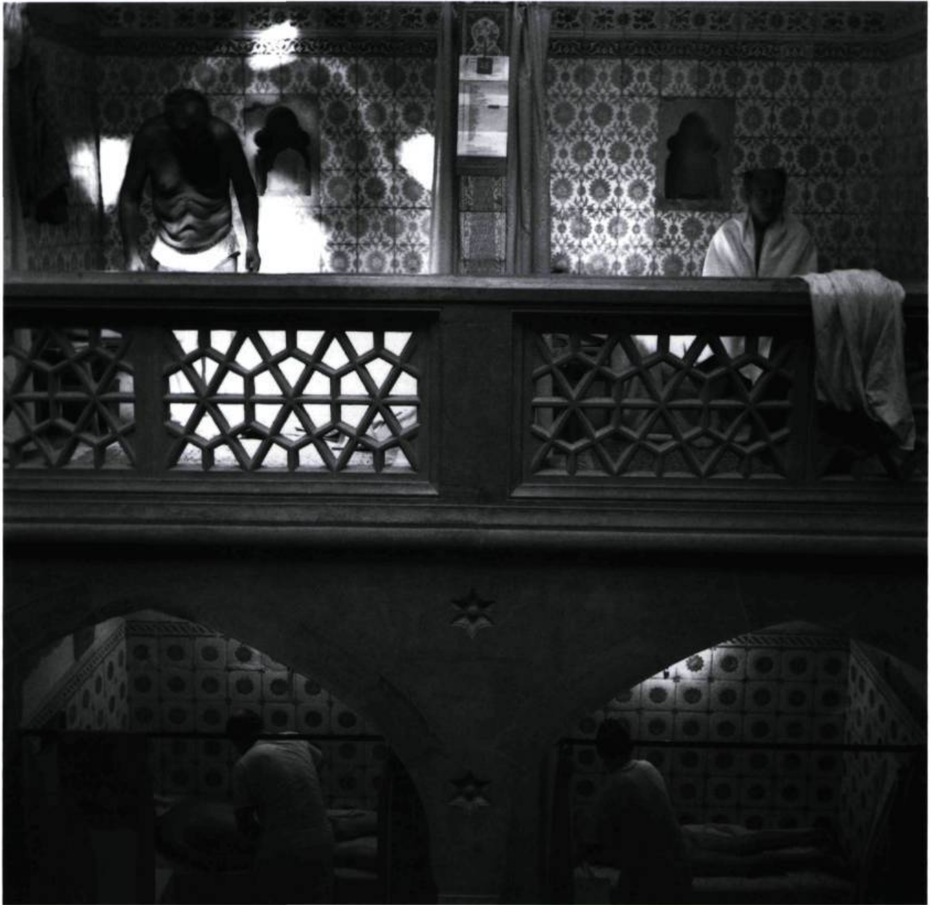
Men's Bathhouse (Hamam)