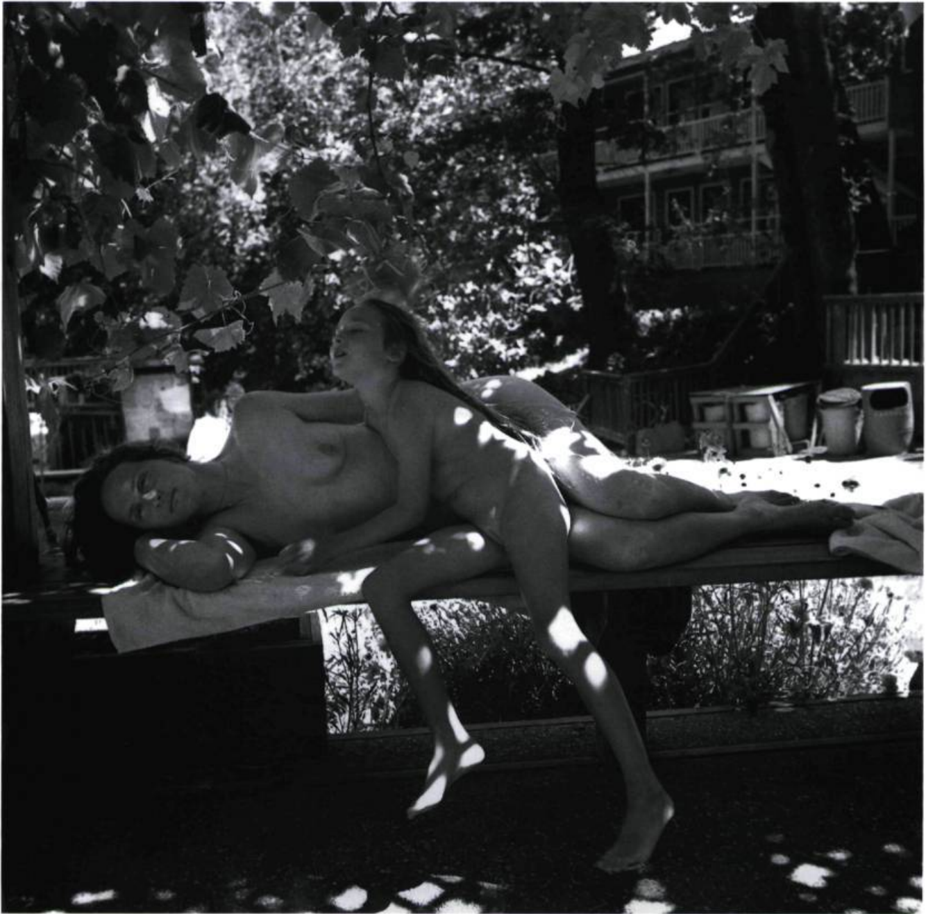
Retreat California 1994