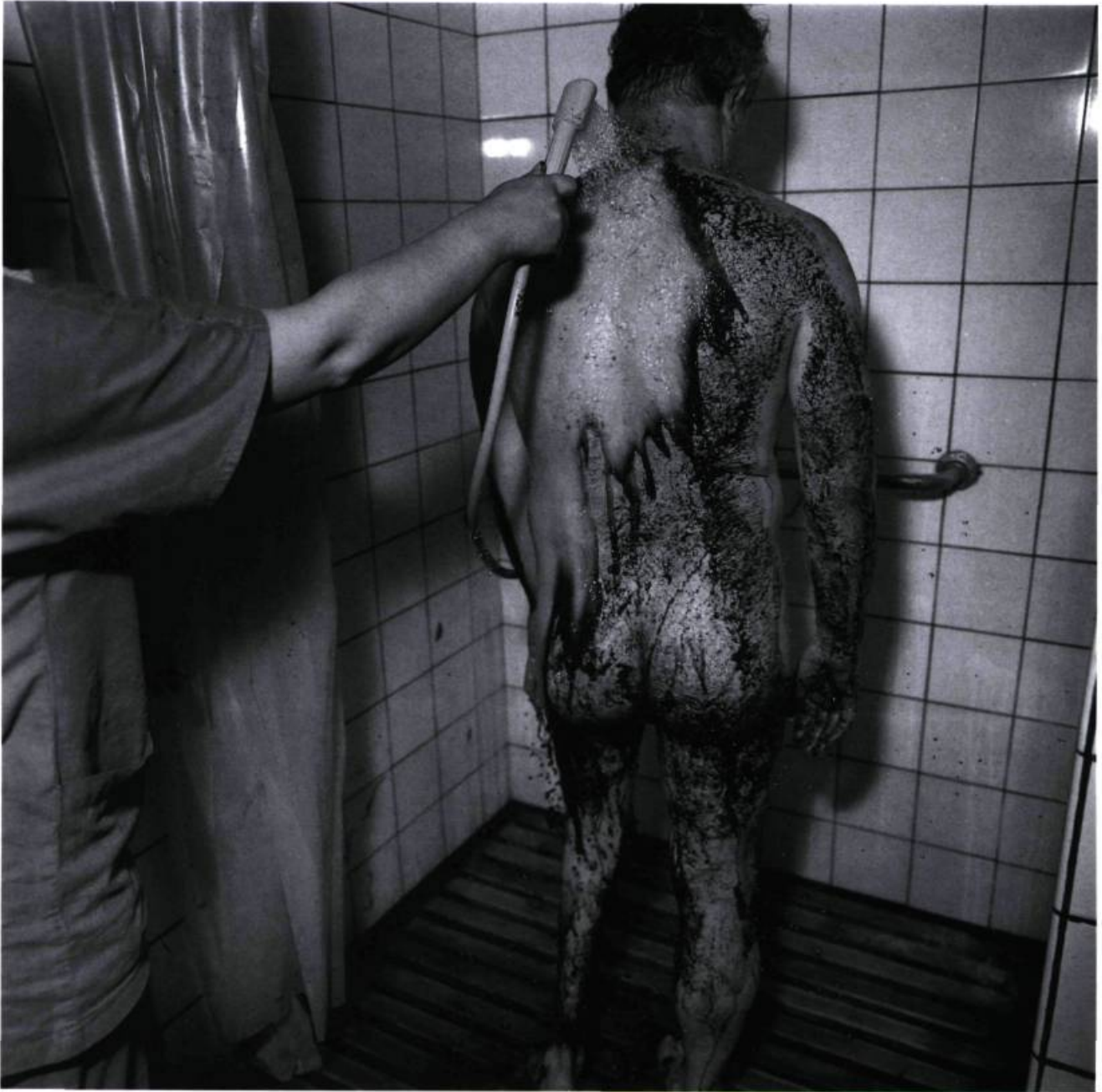
Shower Poland 1994