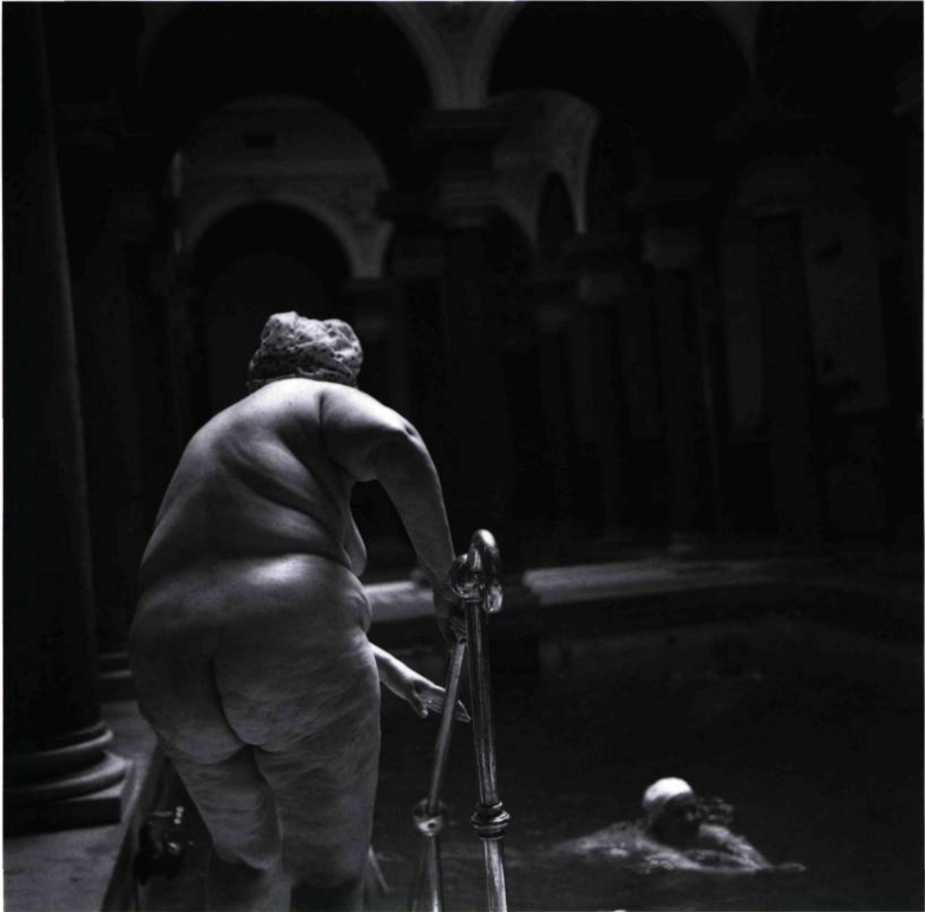
Mineral Bath Marienbad, the Czech Republic 1994