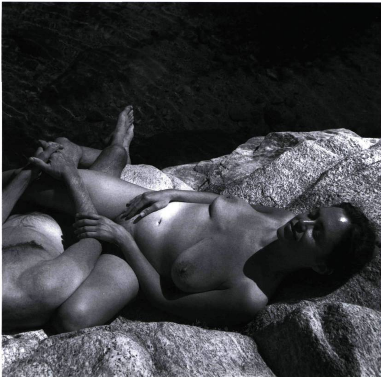
Tessajara Hot Springs California 1994