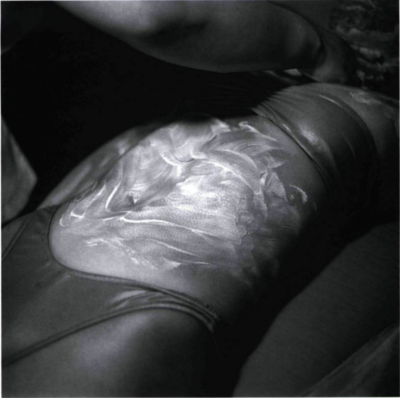
Beverly Hot Springs California 1992