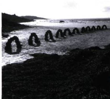
Arche, Andy Goldsworthy, Musée d'art contemporain de Montréal Du 8 avril au 7 juin 1998.

P our la première fois, les habitués du Musée d'art contemporain de Montréal ont eu le privilège de côtoyer pendant quelques semaines une œuvre d'Andy Goldsworthy. Cet artiste, qui travaille en étroite relation avec l'élément naturel, a choisi d'ériger pour l'occasion une structure qui revient constamment dans son travail, une forme archétypale qu'il affectionne pour la force qui s'en dégage : l'arche. Depuis ses débuts dans les années 1970, il en a créé en neige, en glace, en pierres de toutes sortes, parfois dans des situations précaires, parfois dans des positions plus stables, comme celle construite pour le Musée. Le grès rouge a été utilisé pour commémorer un fait historique qui relie le Montréal du XIX ème siècle au pays d'origine de Goldsworthy, l'Écosse 1 . C'est également cette pierre qui a servi à construire l'arche monumentale sise à l'entrée de la Place du Chapiteau sur le terrain du nouveau siège social du Cirque du Soleil à Montréal. Défiant les principes de gravité, la forme emblématique évoque, dans ce cas-ci, l'univers acrobatique où le funambule défie sans cesse les lois de l'équilibre.