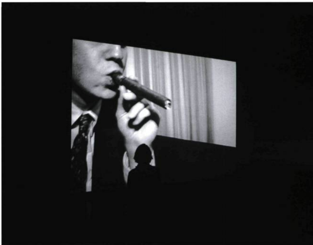
Annika Larsson , Cigar , 1999, DVD, 7 min 13 s.

Ce que le « pouvoir de l'image » met de la sorte en jeu c'est, d'abord et avant tout, la vulnérabilité psychique des récepteurs. Celle-ci n'est pas simplement de l'ordre de la crédulité. Nous sommes au contraire de mieux en mieux avertis de la « préconstruction » des images, même lorsqu'il s'agit comme ici d'images apparemment non préméditées, sans pilote. La préméditation, la mise en scène, n'était tout simplement pas de notre côté cette fois, mais de l'autre, non pas derrière la caméra, mais chez ceux qui ont planifié l'attaque, terroriste et iconoclaste. On ne peut s'empêcher d'apprécier en effet le souci du détail cinématographique et de l'effet spécial sous cette charge symbolique contre une certaine image de l'Amérique, la simulation des