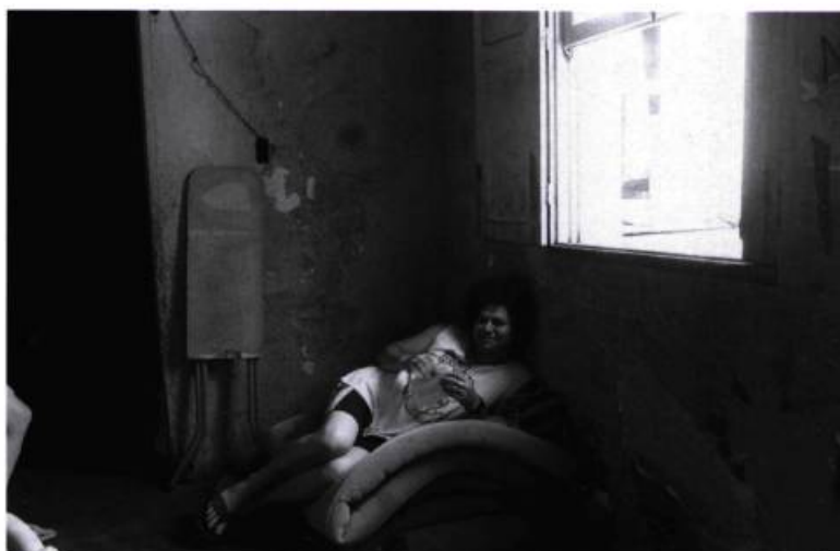
Cascavel, État du Ceará, Brésil (Première photo)