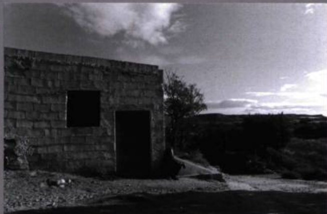
Cuevas, Andalousie, Espagne (photos du bas)