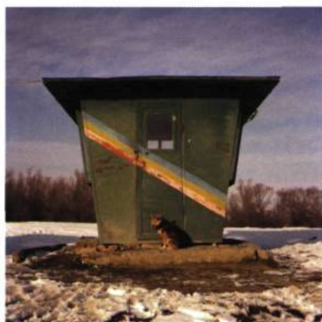
N 45°28'12.0" – EO 28°11'13.4"