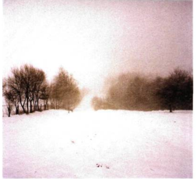
N 47°56'50.1" – EO 25°37'14.5"