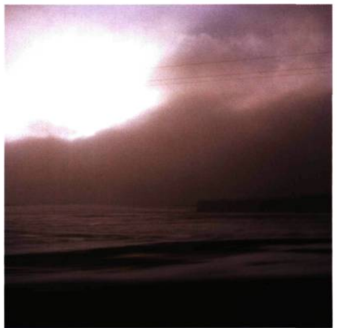
N 55°03'34.8" – EO 22°35'33.3"