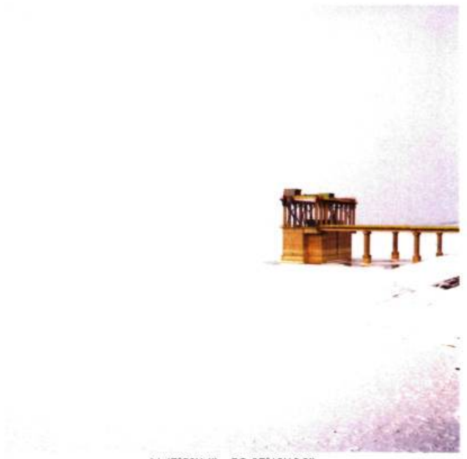
N 47°50'14" – EO 27°13'19.3"