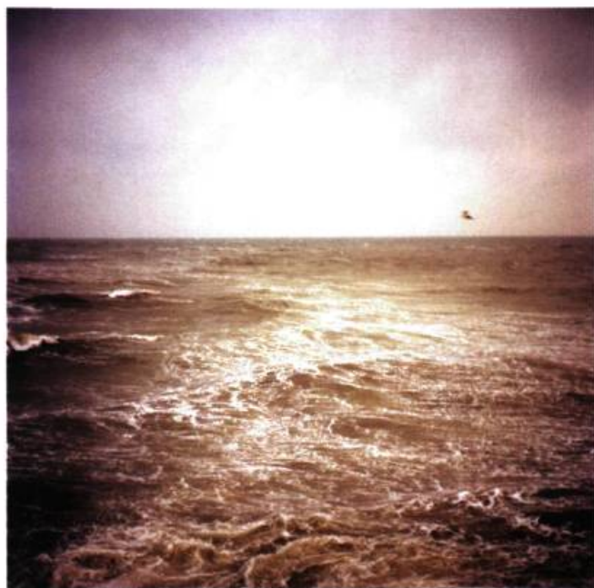
N44°10'19.7" – EO 28°39'55.9"