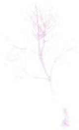
N 49°03'03.3" – EO 22°42'26.4"