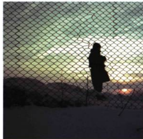
N 45°28'12.0" – EO 28°11'13.4"