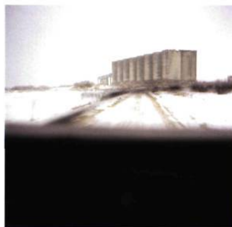
N 55°07'58.9" – EO 21°43'48.9"