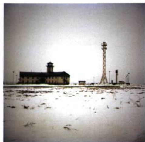
N 54°19'02.6" – EO 25°30'14.3"