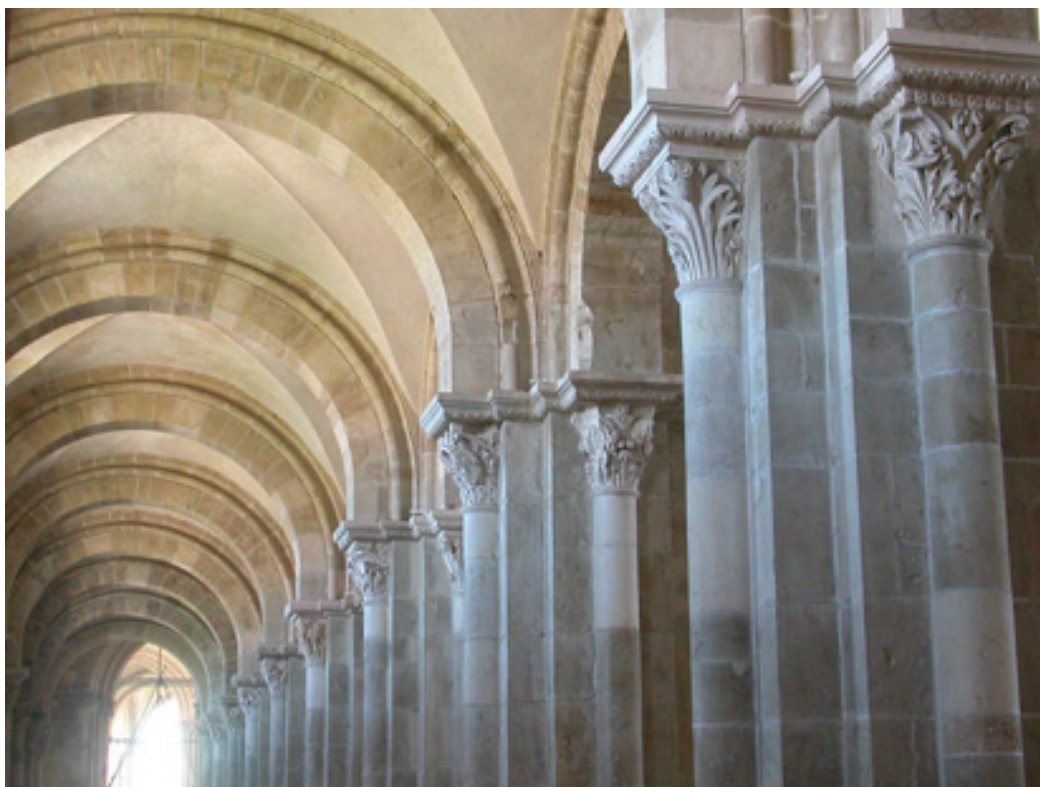
Figure 5. Entrée collatérale nord, chapiteaux à feuillages présentant un traitement plastique distinct de celui des chapiteaux historiés. Basilique Sainte-Marie-Madeleine, Vézelay, France.