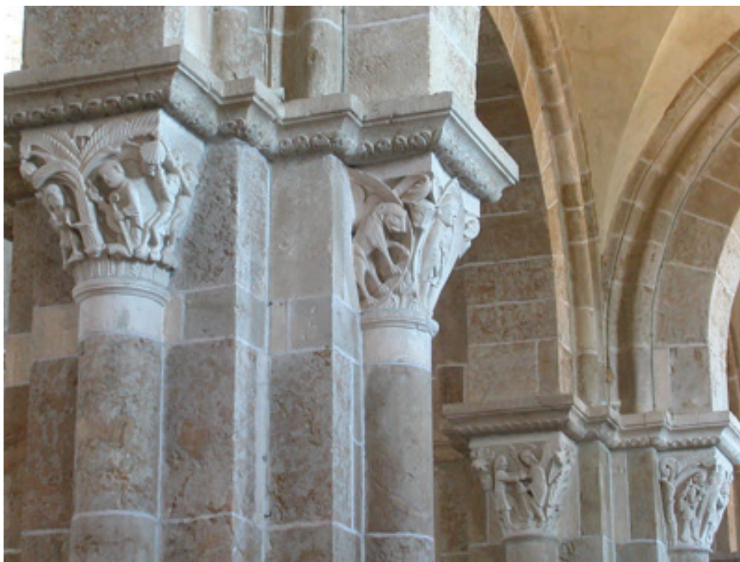
Figure 6. Le Miracle de saint Martin, Daniel dans la fosse aux lions, La Lutte de Jacob avec l'Ange et le retour d'Esau. Entrée collatérale nord, chapiteaux à feuillages présentant un traitement plastique distinct de celui des chapiteaux historiés. Basilique Sainte-Marie-Madeleine, Vézelay, France.

analogique qui forme également le soubassement de la pensée chrétienne. L'un des symptômes les plus récurrents de ce mode de construction des représentations trouve son expression dans la concordance entre l'Ancien et le Nouveau Testaments. C'est par exemple parce que Daniel est à la fosse aux lions ce que Jésus est aux limbes que l'on verra dans cette figure de prophète la préfiguration du Christ. Ainsi, le modèle analogique traverse le raisonnement théologique médiéval et structure les rapports entre les objets, entre les symboles, bref, entre toutes les formes de signes. Il en assure la fécondité mais aussi la multiplicité : car la forme analogique ne peut s'affranchir du contenu des images et assure le renouvellement de sa perception par les ressemblances de rapport qu'elle souligne. On redécouvre ainsi les contenus purement narratifs des chapiteaux en ce que certains aspects de leur teneur font l'objet d'un repérage de ressemblances de rapport.