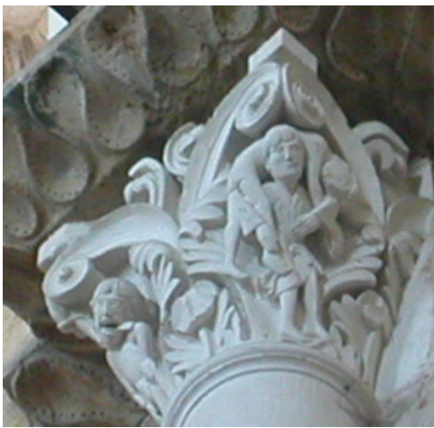
Figure 7. Pendaison de Judas (arête gauche) et dépendaison du corps de Judas (arête droite) porté tel la brebis du Bon Pasteur. Nef centrale, basilique Sainte-Marie-Madeleine, Vézelay, France.

l'un des plus grands abbés de Cluny. La théologie des miracles, dont le programme de Vézelay développe certains aspects, figurait également parmi les éléments ecclésiologiques de Pierre le Vénérable 39 , puisqu'il en fit l'un des ressorts fondamentaux qui structurent son De Miraculis (Le Livre des Merveilles de Dieu). Sans pouvoir disposer de la preuve incontestable du rôle qu'il joua à Vézelay dans l'élaboration du programme iconographique, les indices prélevés comme la volonté de conduire à la conversion tout infidèle, tout païen ; ou encore, la multiplication des évocations des Pères du désert à Vézelay, comme autant d'allusions aux conditions de l'ascèse, dont l'ordre des Chartreux qu'admirait Pierre de Montboissier constitue l'une des références majeures, conduisent néanmoins à faire de sa pensée la principale actrice qui justifie le programme iconographique 40 .