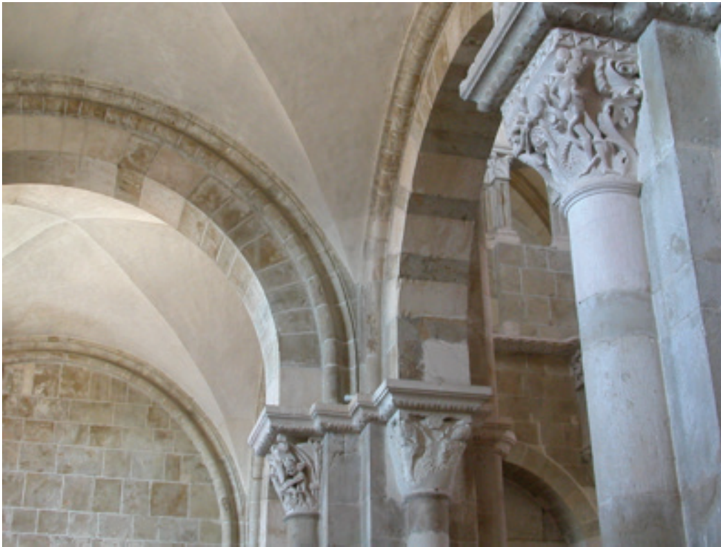
Figure 2. La Luxure, les animaux musiciens, le monstre de l'enlèvement de Ganymède. Collatéral sud, circulation est-ouest, Basilique Sainte-Marie-Madeleine, Vézelay, France.

Les deux photographies, ci-dessus rendent compte du caractère partiel des chapiteaux. La première montre un duel entre animaux hybrides et l'enlèvement de Ganymède ainsi qu'un second duel entre deux hommes vêtus de tuniques de combat chevaleresque, puis l'Orgueil ; alors que la seconde montre la Luxure, les animaux musiciens et le monstre de l'enlèvement de Ganymède. Lorsqu'on emprunte les collatéraux de l'ancienne abbatale, on constate que les chapiteaux composés de plusieurs faces, formant autant de fragments, ne donnent pas à voir les mêmes formes et sujets dans un sens ou dans l'autre. La circulation spatiale d'ouest en est montre des images différentes de celles que l'on peut voir en se déplaçant d'est en ouest. Les vidéos 2 et 4 rendent compte des différences de contenu selon que l'on emprunte le collatéral sud d'ouest en est ou d'est en ouest 8 . En effet, d'ouest en est, les faces visibles mettent en scène des animaux hybrides, des éléments narratifs relevant de la conversion de saint Eustache, ou encore des apiculteurs. Les mêmes piliers dissimulent alors dans ce sens de circulation des chapiteaux ou des faces visibles seulement dans le sens de circulation inverse : sont alors visibles d'est en ouest des éléments thématiques tels que la Justice (le Sein d'Abraham, la Balance, etc.), ou encore l'Orgueil (les animaux musiciens) et bien sûr la Luxure (vidéo 12) – là où le sens de circulation ouest-est insiste sur le Désespoir, autre figure sculptée de ce chapiteau.