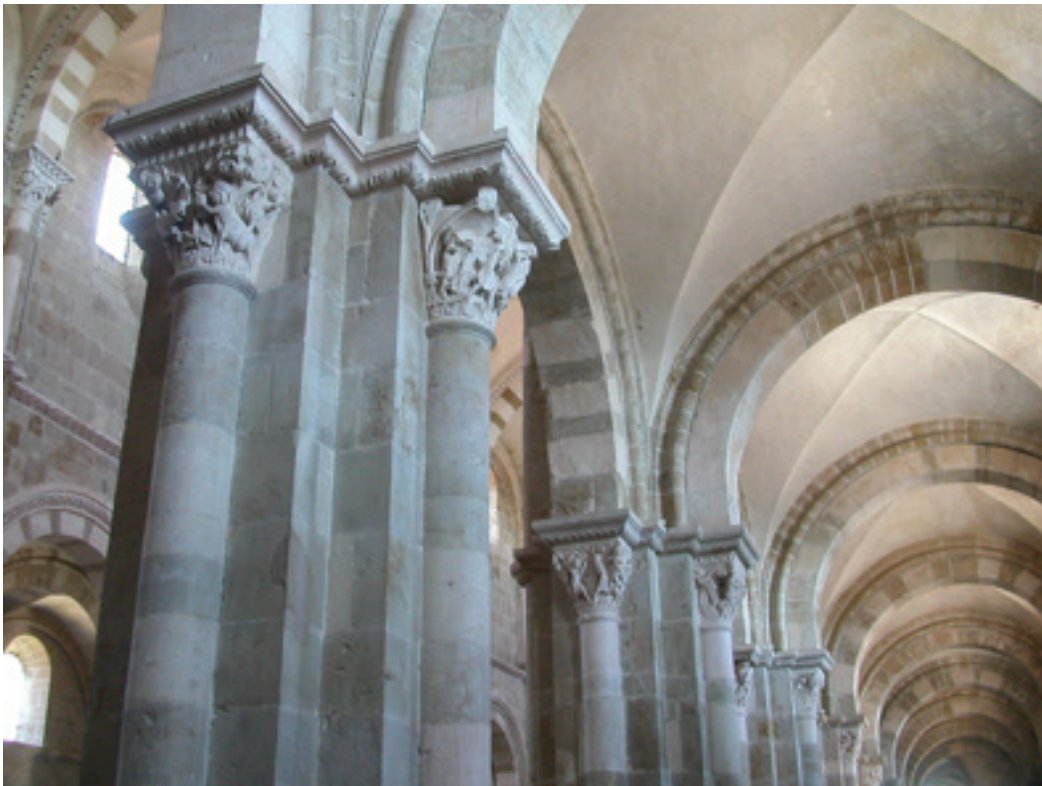
Figure 1. Animaux hybrides, lutte contre le démon qui participe à l'enlèvement de Ganymède, duel entre deux chevaliers et le démon du désespoir qui transperce son propre corps d'une épée, dans une lutte contre lui-même. Collatéral sud, circulation ouest-est, Basilique Sainte-Marie-Madeleine, Vézelay, France.

En effet, le chercheur reconstitue artificiellement une linéarité et une continuité entre les différentes faces d'un chapiteau car pour en observer l'intégralité, il faut bien sûr tourner autour. De plus, la plupart du temps, les chapiteaux montrent une suite narrative organisée autour de la face centrale, les faces latérales fournissant des compléments d'information sur le récit auquel il est fait référence 7 .