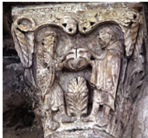
Figure 8. Saint Antoine et saint Paul, ermites. Collatéral nord, basilique Sainte-Marie-Madeleine, Vézelay, France.

Nous avons pu constater ici, que voir constitue un acte qui conduit inévitablement à mettre en relation et en cela met en jeu l'action. Parce que la vision est indissociable de l'agir, le mouvement lui est intimement lié. Aussi nous faut-il sans cesse associer voir et faire . Ces deux modalités, ici conjointes, méritent toutefois quelques éclaircissements, car si la dimension pragmatique associée volontiers à la dimension active et agissante des images semble jouer un rôle dans la question de leur efficacité 41 , il nous paraît opportun d'élargir le spectre de cette combinaison qui lie la vision et l'action.