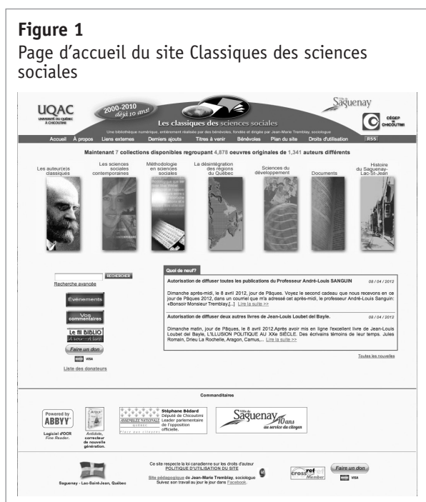
Figure 1 Page d'accueil du site Classiques des sciences sociales