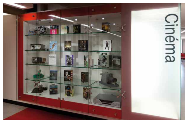
BSHS de l'Université Laval, vitrine cinéma et secteur cinéma fauteuil

À l'Université Laval, les projets architecturaux sont sous la responsabilité du Service des immeubles, qui travaille en étroite collaboration avec le service auteur