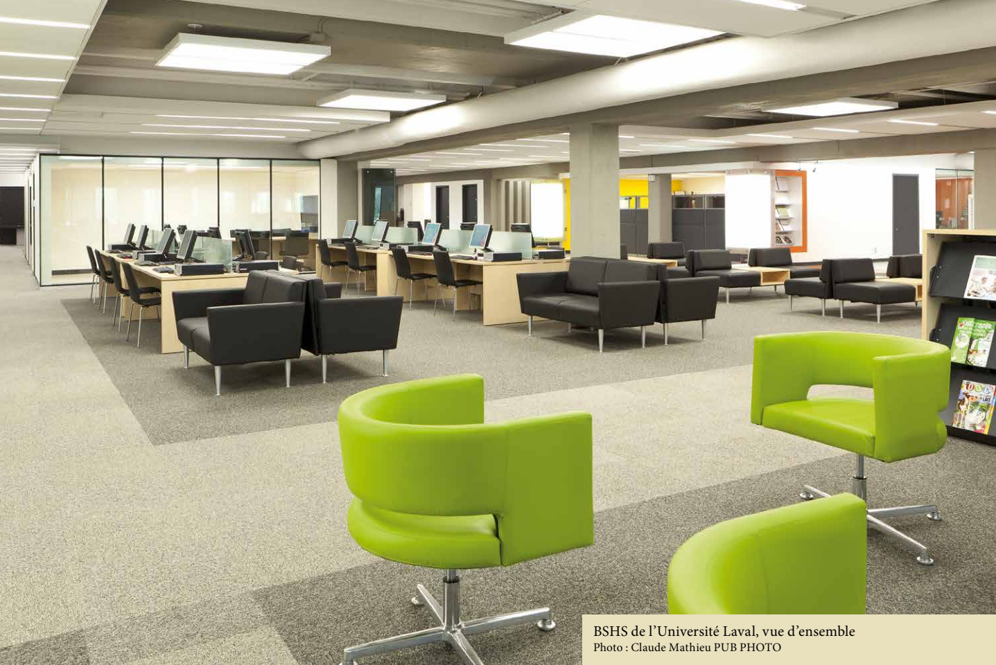
BSHS de l'Université Laval, vue d'ensemble PUB PHOTO