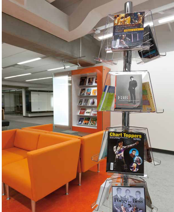
BSHS de l'Université Laval, secteur musique, présentoir Photo : Claude Mathieu PUB PHOTO

du projet. Tous deux sont identifiés à titre de clients du projet par les architectes. Selon le mode du processus de gestion intégré, un comité de suivi est mis en place et présidé par le chargé de projet, généralement la firme d'architectes retenue à la suite de l'appel d'offres. Ce comité regroupe les divers spécialistes embauchés par l'Université (ingénieurs, architectes, spécialistes en analyse sismique, en économie d'énergie, etc.) ainsi que les « clients ». Les membres de l'Université représentés au comité ont des niveaux de responsabilités différents qui peuvent complexifier le dialogue avec les architectes.