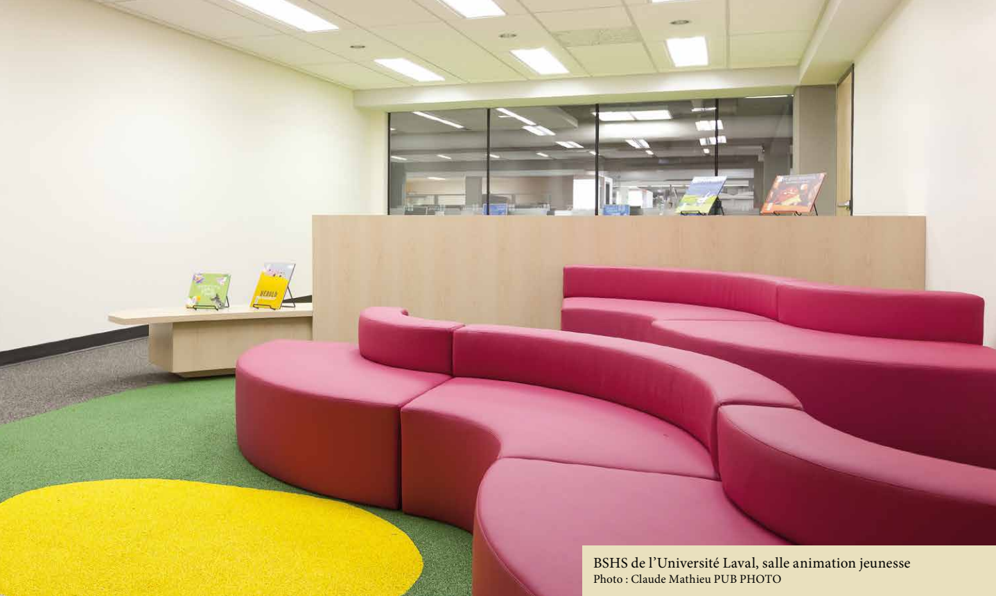
BSHS de l'Université Laval, salle animation jeunesse

Les différents acteurs du projet ont donc dû cheminer en se ralliant à la nouvelle vision bibliothéconomique et en comprenant son impact sur l'aménagement des espaces et sur les coûts. Dans ce contexte, il était primordial que chacun des intervenants soit au même niveau et se sente autorisé d'apporter sa vision et son expertise spécifiques, et ce, dans le cadre de son propre mandat. Des présentations, des discussions animées et des visites ont permis d'articuler plus clairement le projet au moyen d'exemples et de mettre à niveau l'équipe de gestion intégrée du projet.