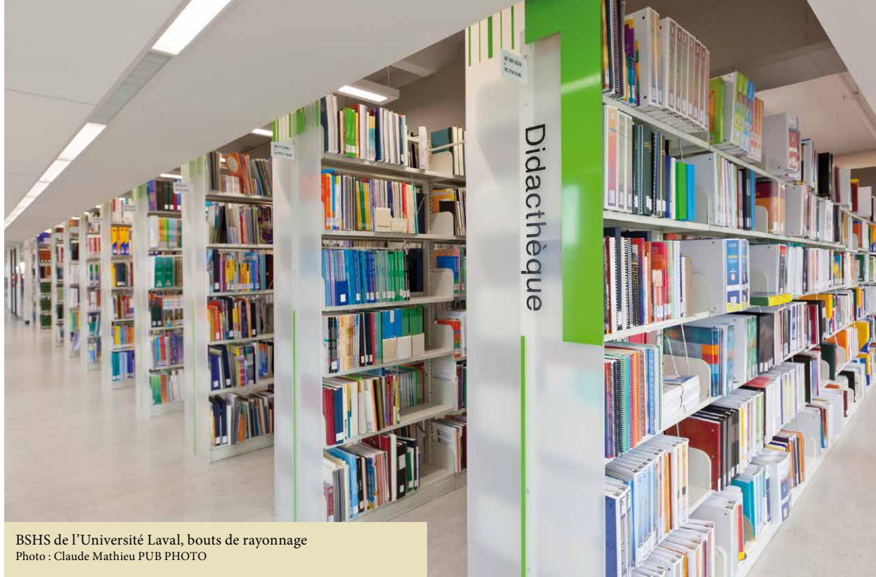
BSHS de l'Université Laval, bouts de rayonnage PUB PHOTO

simultanément virtuel) au cœur du service et de l'accès aux collections par le biais de sa mission :