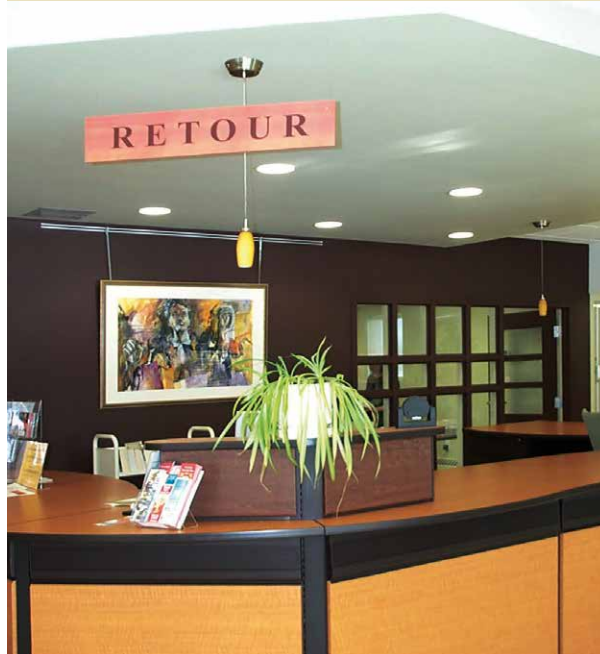
Bibliothèque de Saint-Anicet

Projet d'une nouvelle bibliothèque logée dans une ancienne école, entièrement rénovée, perpétuant la vocation éducative des lieux.