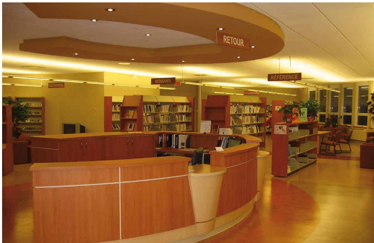
Bibliothèque municipale Laurent-Caron de Saint-Anselme

De la dizaine de candidatures reçues par le jury provincial à chaque édition, cinq bibliothèques sont ressorties grandes gagnantes du Prix Gérard-Desrosiers :