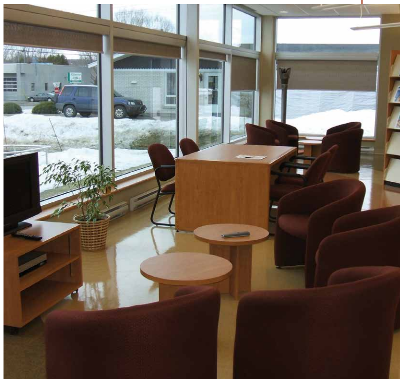
Bibliothèque municipale Saint-François d'Assise de Vallée-Jonction

Projet de relocalisation de la bibliothèque dans de nouveaux locaux modernes, plus spacieux et plus faciles d'accès, situés au cœur de la ville.