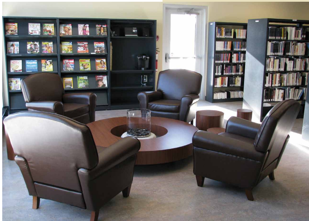
Bibliothèque municipale Marielle-Brouillette de Saint-Tite