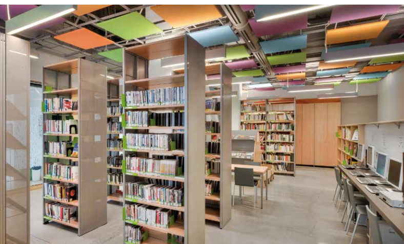
Goethe-Institut Montréal, vue de la bibliothèque à partir du bureau de la référence

En collaboration avec la direction et l'administration du Goethe-Institut Montréal, ainsi qu'avec les architectes d'Atelier TauTem et ceux du Goethe-Institut à la direction centrale de Munich, et grâce aussi à des recherches effectuées sur Internet, des réponses ont été trouvées aux questions suivantes : comment les bibliothèques modernes sont-elles aménagées en Allemagne et en Europe? Quelles sont leurs innovations? Qu'est-ce qu'on y trouve comme mobilier? Le nom d'un fournisseur revenait souvent : SCHULZ SPEYER. Plusieurs autres Goethe-Institut ont fait affaire avec cette compagnie allemande fondée en 1955. Une demande de soumission de mobilier lui a été adressée, ainsi qu'à deux fournisseurs locaux reconnus : Brodart et PRISMA. En termes de coûts, les trois soumissions étaient plutôt similaires. Après avoir évalué les différents types de mobiliers offerts, les matériaux, les services connexes (livraison, assemblage), l'originalité et la compatibilité avec la vision de nos architectes, la décision a été prise de retenir les services de SCHULZ SPEYER.