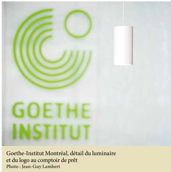
Goethe-Institut Montréal, détail du luminaire et du logo au comptoir de prêt

Directrice, Information & Bibliothèque Goethe-Institut Montréal poulin@montreal.goethe.org