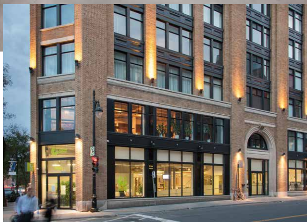
Goethe-Institut Montréal, vue extérieure des façades avec entrée principale (à gauche) et entrée des employés (à droite)

état, quoique quelque peu désuets. En dehors des heures d'ouverture (limitées à 17 heures par semaine), la bibliothèque était verrouillée, et le prêt ou la consultation de documents ne s'effectuait que sur prise de rendez-vous.