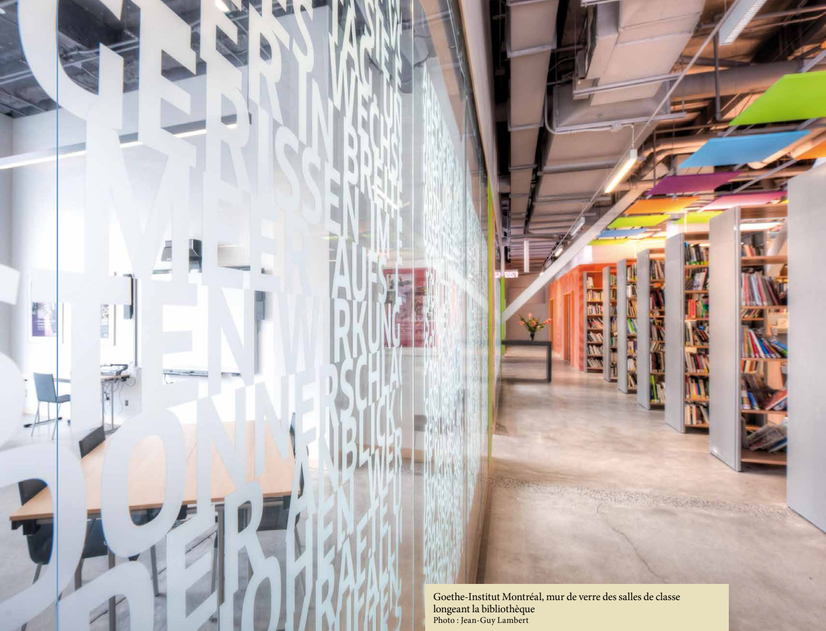
Goethe-Institut Montréal, mur de verre des salles de classe longeant la bibliothèque

la bibliothèque. Il s'agit d'un changement d'orientation radical par rapport à ses incarnations précédentes. La bibliothèque sert désormais de lieu de rencontre et d'échanges entre l'axe culturel de l'institut (salles de classe, salle multimédia, le café) et l'axe administratif. Visible depuis l'entrée, elle pique la curiosité, enchante les visiteurs et surprend ceux qui en découvrent l'existence.