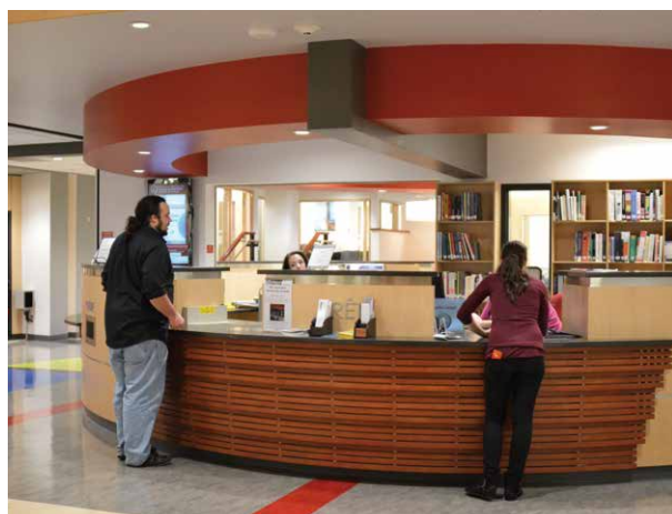
Bibliothèque Gilles-Vigneault, comptoir de prêt

sonnement maximal des espaces et dans une juxtaposition étudiée des services qui associe l'ancien et le contemporain. D'abord, la création d'une mezzanine ouvrant les étages les uns aux autres recrée l'imposant volume architectural, encore accentué par le dégagement des voûtes de l'ancienne chapelle. Ensuite, l'utilisation du verre — pour les cloisons des bureaux et des salles de travail en équipe — ajoute à cette impression de vastitude des espaces. Le dégagement des fenêtres en plein cintre contribue pour sa part à ce que la bibliothèque bénéficie d'un éclairage naturel optimal, tout en permettant aux usagers d'avoir une vue incomparable sur la ville et le fleuve. Le tout est réalisé avec un souci esthétique indéniable : rondeur des comptoirs de prêt et de référence rappelant celle des voûtes; utilisation de différentes teintes de bois ainsi que de l'ardoise naturelle pour la cage d'ascenseur; coloris sobres avec des accents vifs sur le linoléum et sur quelques pans de mur. Si chaque étage possède son propre caractère — imposant comptoir de prêt au premier, spectaculaire fenestration au deuxième et mise en valeur des voûtes au troisième —, la configuration ouverte des lieux permet une interpénétration des espaces, et les rappels de formes, de couleurs et de matériaux assurent une harmonie d'ensemble.