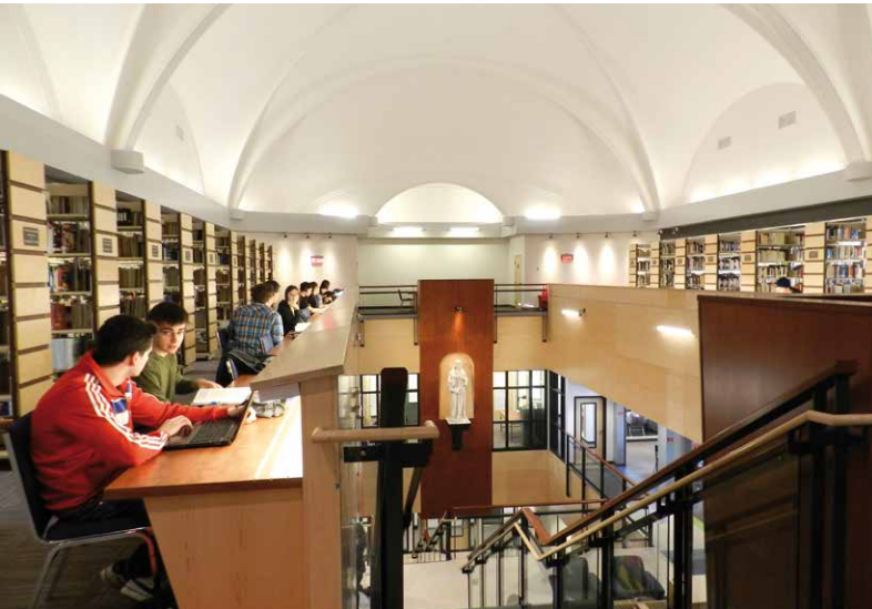
Bibliothèque Gilles-Vigneault, voûtes aperçues du troisième étage

Architecte et enseignant retraité Cégep de Rimouski mlsp@globetrotter.net