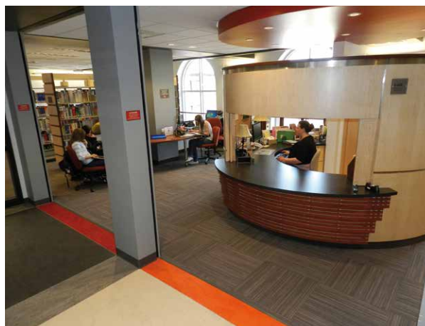
Bibliothèque Gilles-Vigneault, comptoir de référence

Dans l'esprit du troisième lieu, le comité voulait faire de la bibliothèque non seulement un lieu d'étude, mais également un espace de rencontre et d'échange. Ainsi, l'aménagement inclut de nombreuses salles de diverses grandeurs, de l'équipement audiovisuel et informatique, des fauteuils confortables bien répartis sur les étages. La bibliothèque continue également d'accueillir les usagers externes qui désirent une documentation plus spécialisée, et la création d'un coin de littérature jeunesse permet aussi de recevoir des groupes d'enfants. Pour créer un véritable travail collaboratif entre les étudiants, certains locaux sont réservés à des réunions et à des cours en petits groupes. Bref, le carrefour de l'information est désormais un lieu stimulant et accueillant.