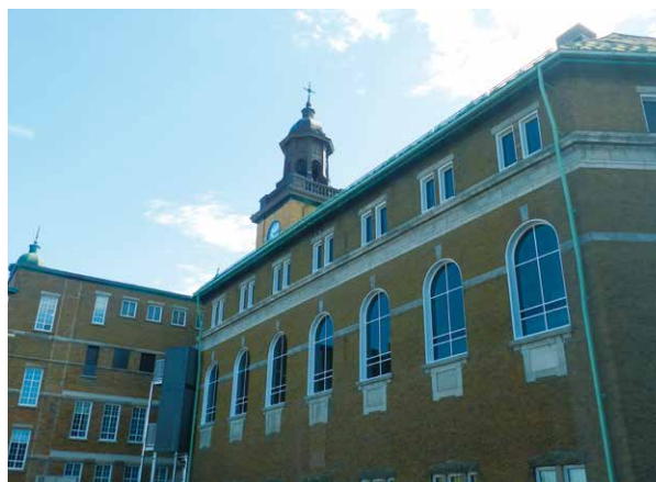
Bibliothèque Gilles-Vigneault, fenêtres en plein cintre vues de l'extérieur

Ce réaménagement aura permis à la Bibliothèque Gilles-Vigneault d'entrer de plain-pied dans le XXI e siècle. Loin d'une intervention cosmétique, le concept même de bibliothèque a été redéfini et élargi. C'est désormais un endroit apprécié, vivant et dynamique où le silence est davantage l'exception que la règle. Les dernières statistiques de fréquentation confirment la justesse des choix effectués par les architectes et le comité des usagers : à titre d'exemple, de 2007 à 2013, le nombre d'entrées par année est passé de 93 903 à 103 679. Par ailleurs, il est indéniable que le mode de gestion collégial du réaménagement a été un élément fédérateur pour la communauté et a contribué au succès actuel de la bibliothèque.