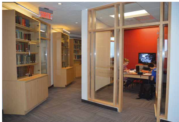
Bibliothèque Gilles-Vigneault, salle de travail en équipe

Quelles ont été les principales orientations prises par le comité des usagers? Celles allant dans le sens de l'ouverture, véritable leitmotiv du projet. En misant sur le modèle du « carrefour de l'information » ainsi que sur certains principes du « troisième lieu », et en mettant au centre de ses préoccupations les besoins des usagers davantage que sa collection, la bibliothèque s'ouvrait d'un point de vue conceptuel. Dans ce même esprit, l'idée de fusionner les ressources multimédias à la bibliothèque permettait un enrichissement de l'offre de services en matière de TIC (technologies de l'information et de la communication) dans un seul et même lieu. Un troisième élément s'est également greffé au projet, « L'Apprenti sage », un centre d'aide méthodologique qui s'intègre parfaitement dans la mission d'aide à la réussite de la bibliothèque.