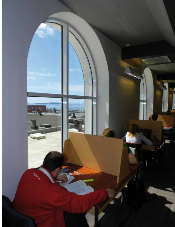
Bibliothèque Gilles-Vigneault, fenêtres en plein cintre

Ce travail de restauration architecturale s'avère également une ouverture de la bibliothèque sur son histoire. L'identité de la chapelle est réaffirmée par les voûtes, les fenêtres anciennes et aussi par la mise en valeur de la statue originale de Saint-Antoine qui a dominé la façade du bâtiment principal jusqu'en 2004. Ces éléments du passé créent un contraste avec l'omniprésence de la technologie (écrans d'affichage, ordinateurs et postes de visionnement), sans pour autant causer une impression de dissonance. Des citations de Gilles Vigneault, inscrites sur certaines parois de verre, rendent par ailleurs hommage à cet ancien élève du Petit séminaire.