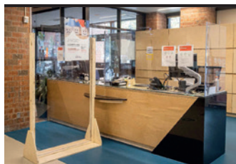
Ville Montréal – Arrondissement Côtes-des-Neiges-Notre-Dame-de-Grâce. Bibliothèque Côtes-des-Neiges

Les Architectes Labonté Marcil (Rénovation majeure)