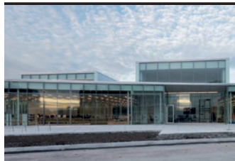
Ville de Gatineau – Bibliothèque Donald-Charron

Atelier TAG | NEUF architect(e)s en consortium (Bâtiment neuf)