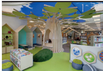
Ville de Brossard – Bibliothèque de Brossard Georgette-Lepage

En 2021, le prix Architecture a été remis pour des projets réalisés entre le 1 er juillet 2019 et le 30 juin 2021. Le jury a étudié dix dossiers de bibliothèques présentant des projets auxquels ont participé sept firmes d'architectes :