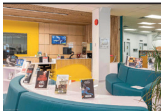
Ville de Montréal – Arrondissement - Le-Sud-Ouest. Bibliothèque Saint-Henri

Les Architectes Labonté Marcil (Rénovation majeure)