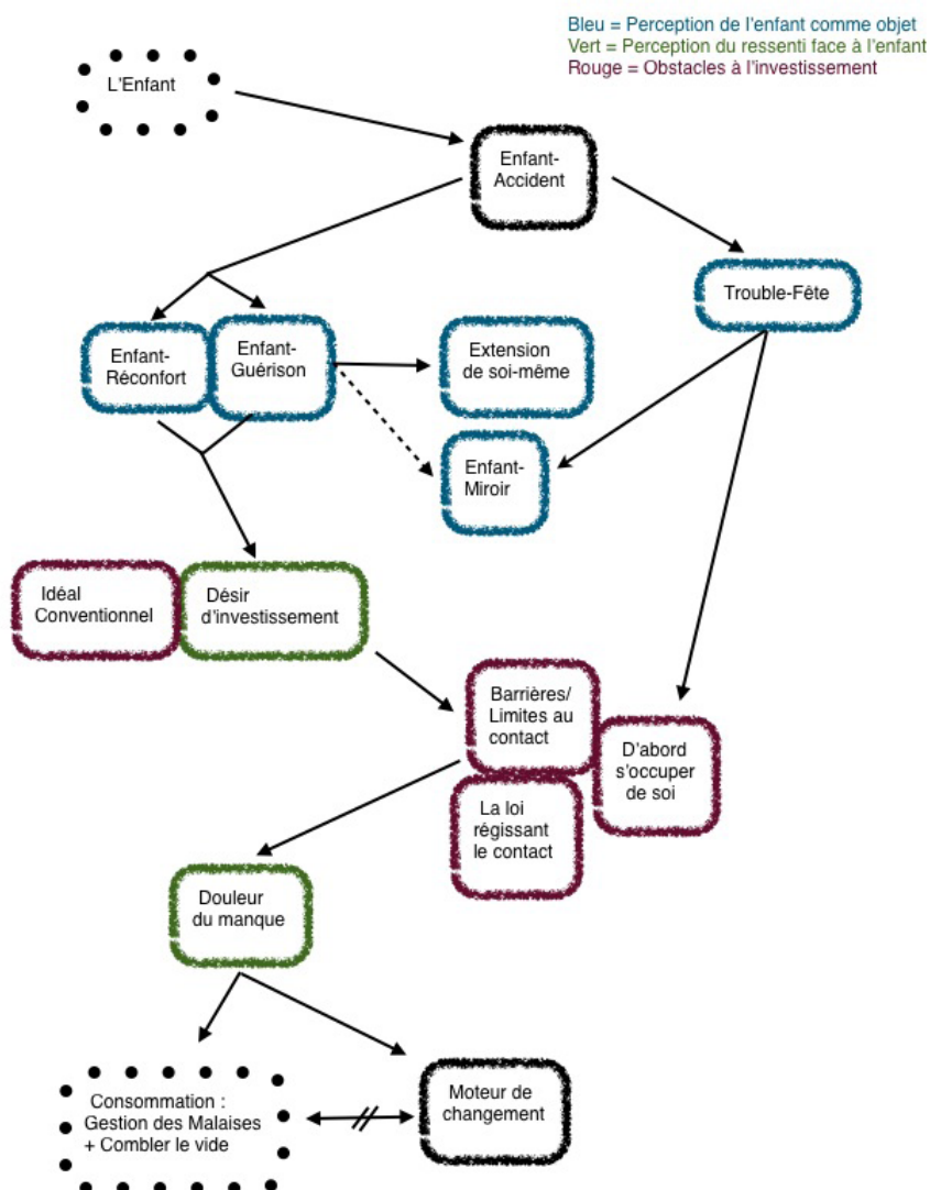
Figure 1 : Représentations associées à l'enfant