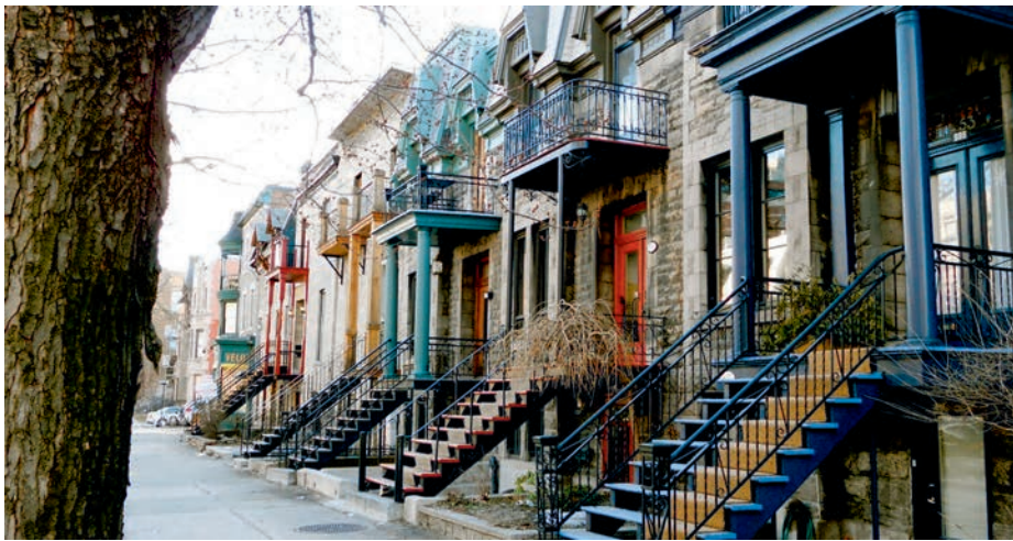
Le Plateau Mont-Royal, à Montréal.

trop bien gardé, situé dans une maison patrimoniale de la rue de la Montagne, il reprend la même promenade dans ce cadre, sur demande des visiteurs.