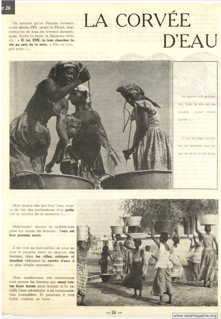
Figure 4 – Awa, mars 1964, p. 26.

pauvreté extrême (voir figure 4). Cette prénomination et surtout la manière dont le magazine file son interprétation montrent que les conceptrices du magazine avaient conscience de la difficulté de leur tâche. Si Awa désigne pour certains lecteurs le fantasme du magazine, pour ses rédactrices, ce nom renvoie à son inconscient.