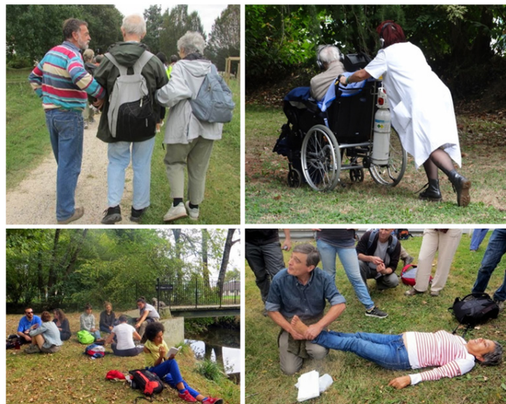
Figure 4. La « marchabilité » comme condition de faisabilité de la balade.