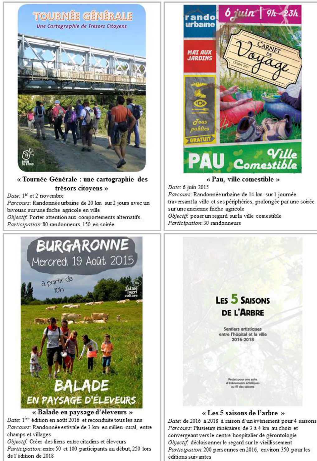
Figure 1. Balades habitantes : les défis de l'articulation entre problématiques globales et appropriations territoriales.