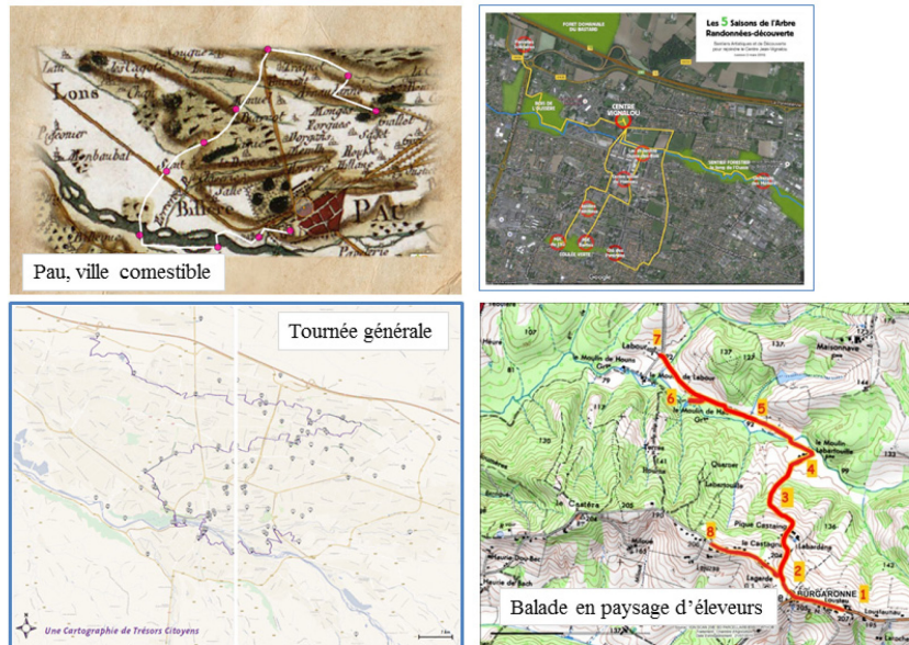
Figure 3. Des itinéraires bien rodés (Source : programme des randonnées distribuées aux participants).

comestible (en la faisant déguster en confiture), alors même que d'un point de vue naturaliste elle est très fréquemment présentée comme étant particulièrement invasive.