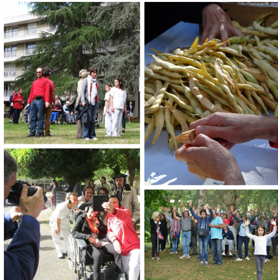
Figure 5 Le corps médiateur pour une relation à soi, à l'autre et à son environnement.

Sur le chemin de découvertes multiples, en relation avec les thématiques des balades (les diverses reconnections évoquées), les participants peuvent également se réapproprier une variété de rythmes, faire l'expérience d'autres temporalités : une programmation qui se dévoile peu à peu, au fur et à mesure de la journée ou de deux jours; la saisonnalité de la nature; les temps de la vie jusqu'au vieillissement; les ruptures de rythme au fil de la balade (y compris des temps de sieste); bref, le temps des autres pour se signifier à soi-même que la ville est multitemporelle et que prendre en compte ces chronotopies est essentiel pour qui aspire à une ville habitable pour tous, à échelle humaine (Gwiazdzinski, 2016) 15 .