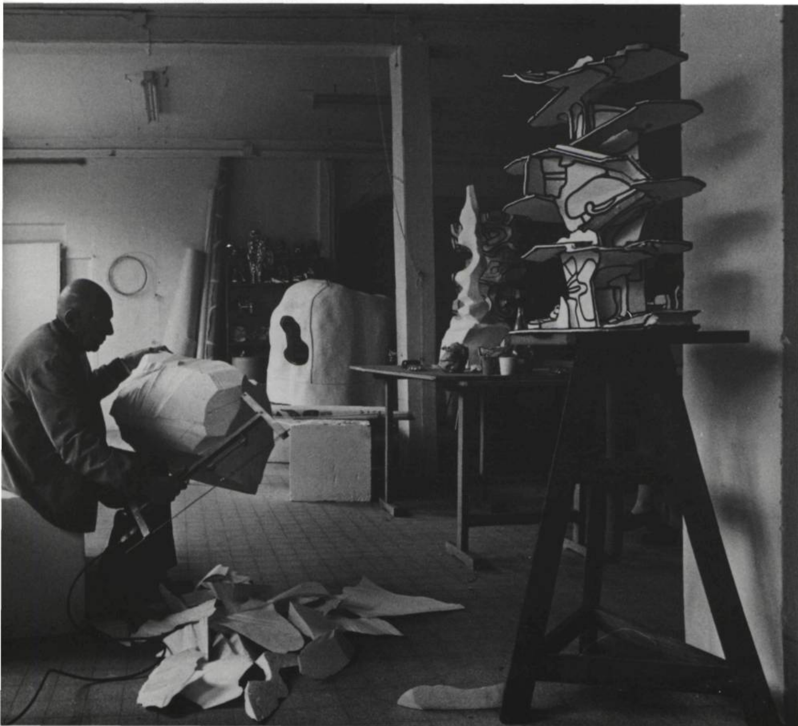
Jean Dubuffet dans son atelier (1970).

Mais qu'en est-il des donations qui, non seulement peuvent alléger le