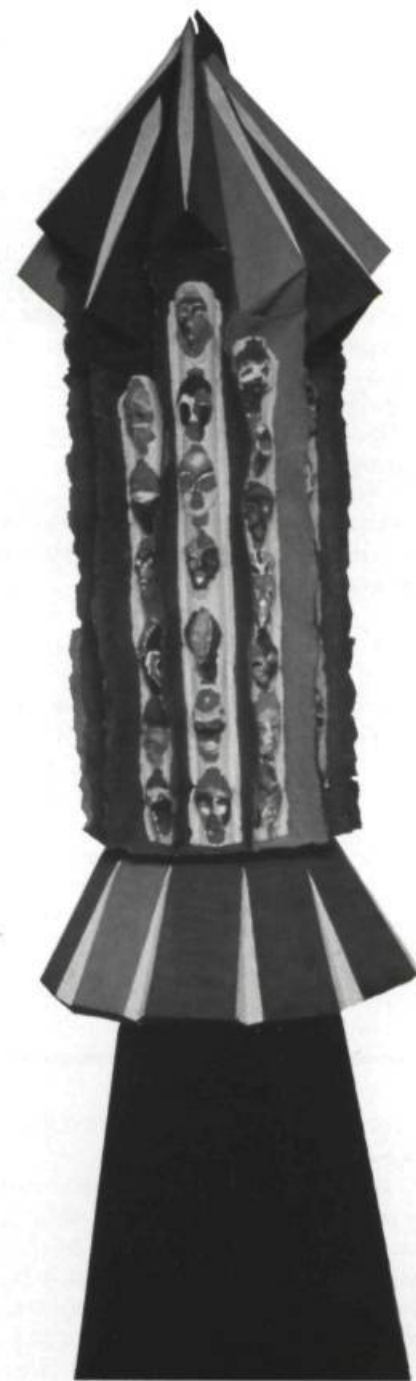
Rusdi Genest, Patente No. 11- "Synthétiseur de Rêves" ( Dial yourself your own dream- Console One ), 1985, papier matière polychromé, 140 X 55 X 55+85 cm.

*Signalons les Cent jours de l'art contemporain et les événements "Confrontation" du Conseil de la Sculpture du Québec.