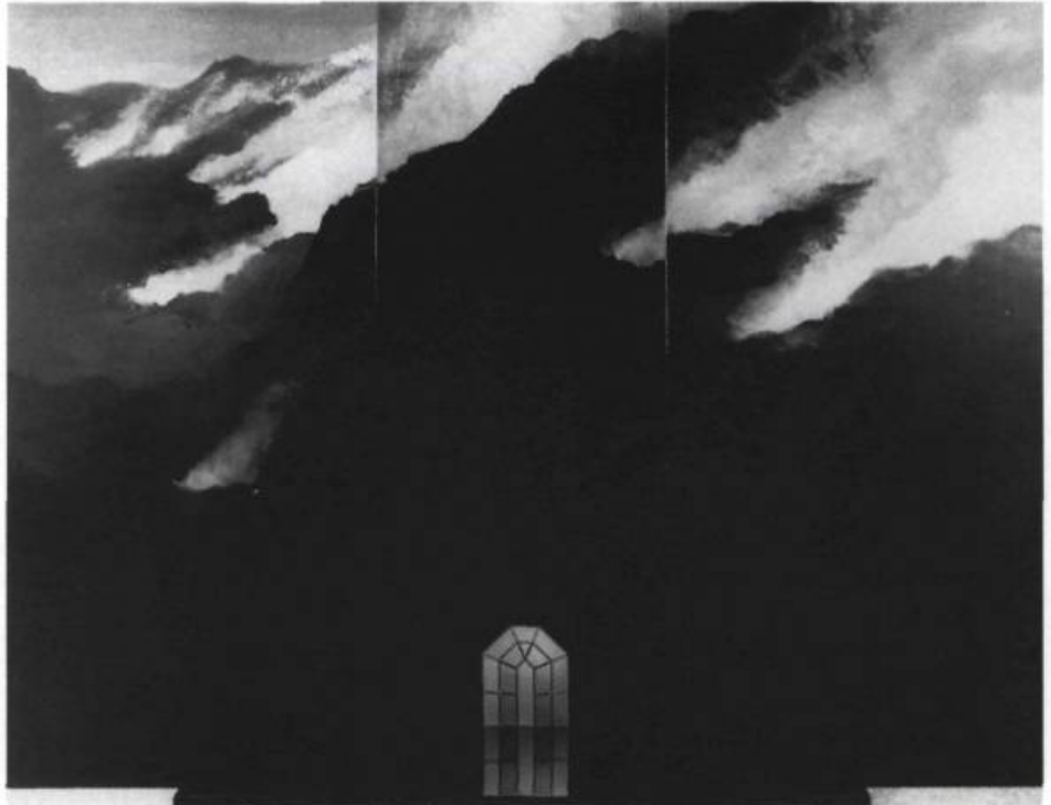
Jocelyn Gasse, Composition no. 108 , 1988, bois peint polyuréthane, vitrail, 220 X 270 X 140 cm.

Les artistes nous reçoivent chaleureusement, ils quittent un moment leurs outils, entament une discussion sur ce qui est exposé ou parlent du projet en cours. L'intimité du lieu et l'originalité de la présentation des œuvres rendent chacune des visites très personnelle.