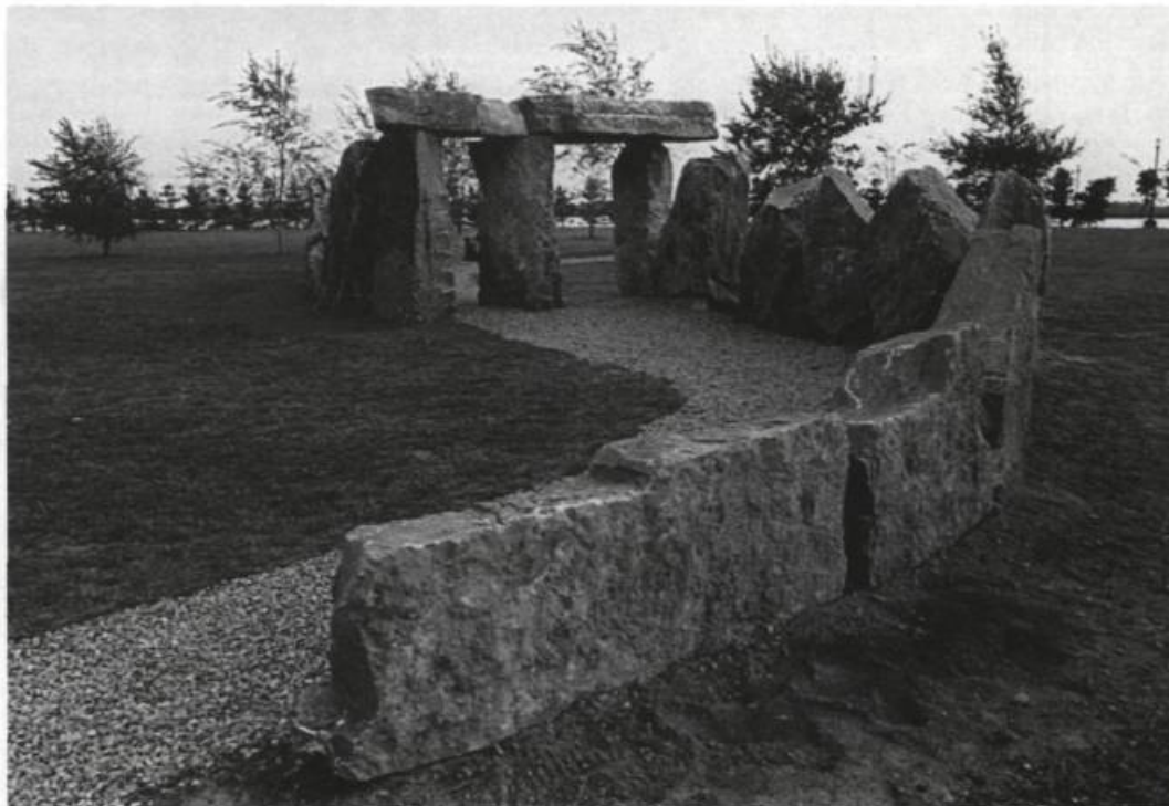
Bill Vazan, Vortexit , 1988. Pierres de Montréal. 60' x 10' x 20'. Parc René-Lévesque. Symposium de Lachine.

C'est dans les années d'après-guerre, 2 qu'est née l'idée du symposium de sculpture avec l'objectif premier de donner aux artistes l'occasion de se rencontrer, de partager, et d'échanger entre eux. (Le terme d'ailleurs vient de sumposium et signifie banquet) 3 . Et si, au départ, le symposium a surtout été réservé au monde scientifique et désignait une sorte de colloque, de congrès de spécialistes traitant un sujet particulier, il s'est étendu aujourd'hui à d'autres milieux dont celui de l'art. En sculpture, il définit généralement la rencontre ponctuelle de quelques artistes en vue de réaliser des oeuvres monumentales, extérieures et permanentes et ce, au vu et au su du public. En cela, les symposiums que nous connaissons diffèrent de ceux d'Europe où, le plus souvent, il s'agit d'une rencontre privée entre sculpteurs professionnels dans le but de fraterniser et de favoriser des échanges avec des intervenants d'autres pays. Tandis qu'ici, à l'aspect animation et manifestation publique, où les citoyens sont invités à voir les artistes à l'oeuvre (parfois même à s'impliquer davantage en ayant un droit de regard sur le choix