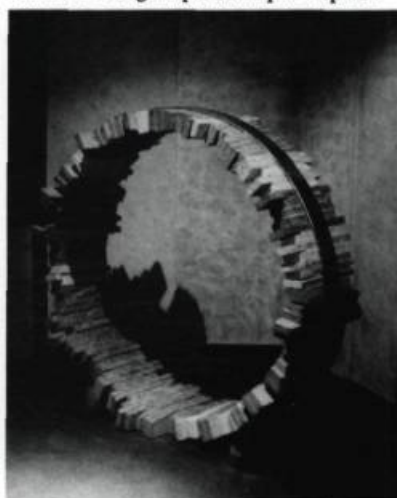
Jean Brillant, Le cercle de la vie , 1989. Granite, acier. Diam. : 9'

Traduit de l'anglais par Monique Crépault.