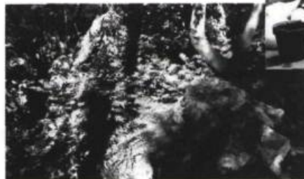
Jocelyne Duchesne, Territoire interdit , 1990. Papier fait main, cire et polymère. Escalier Laviguer.