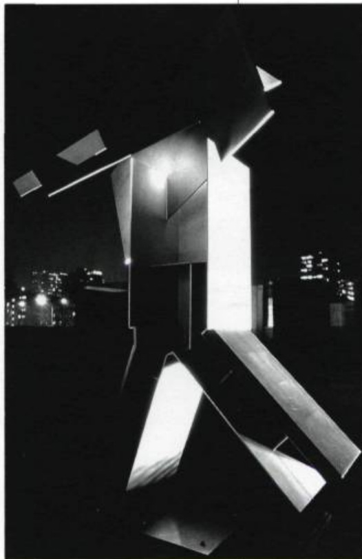
Melvin Charney, le Jardin du Centre Canadien d'Architecture, Montréal: vue nocturne de «La Tribune», l'une des dix colonnes allégoriques de l'Esplanade / Canadian Centre for Architecture Garden, Montréal: Night view of "The Tribune". One of ten Allegorical Columns erected on the Esplanade.

En quittant le jardin, j'aperçois deux jeunes hommes assis à l'autre extrémité de l'enceinte. Ils font face à la ville, le dos tourné à Verdun