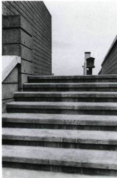
Le Jardin du Centre Canadien d'Architecture de Melvin Charney: vue depuis le nord montrant l'escalier ouest de l'Arcade et deux des dix Colonnes allégoriques de l'Esplanade. / The Canadian Centre for Architecture garden by Melvin Charney: Looking South, showing the Western Steps of the Arcade, and Two of the Ten Allegorical Columns on the Esplanade. Collection Centre Canadien d'Architecture / Canadian Centre for Architecture. Photo: Serge Clément.

Here is a place of disaffection Time before and time after In a dim light: neither daylight Investing form with lucid stillness Turning shadow into transient beauty With slow rotation suggesting permanence Nor darkness to purify the soul Emptying the sensual with deprivation Cleansing affection from the temporal. 2