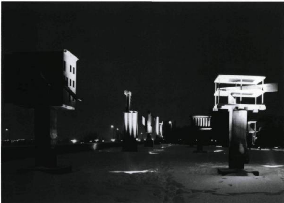
Melvin Charney, Le jardin du Centre Canadien d'Architecture, Montréal: Vue nocturne de l'Esplanade / The Canadian Centre for Architecture Garden, Montréal: Night View of the Esplanade. Centre Canadien d'Architecture / Canadian Centre for Architecture, Montréal.

end of the walled enclosure. These two, unlike the rest of us, face the city, disinterestedly away from Verdun and St. Henri below, the referents of the works themselves. These men, too, are talking, but they face the city of Montreal. As I watch them, their eyes draw me to think of the buildings, museums, and mountains behind me which I cannot see. I am