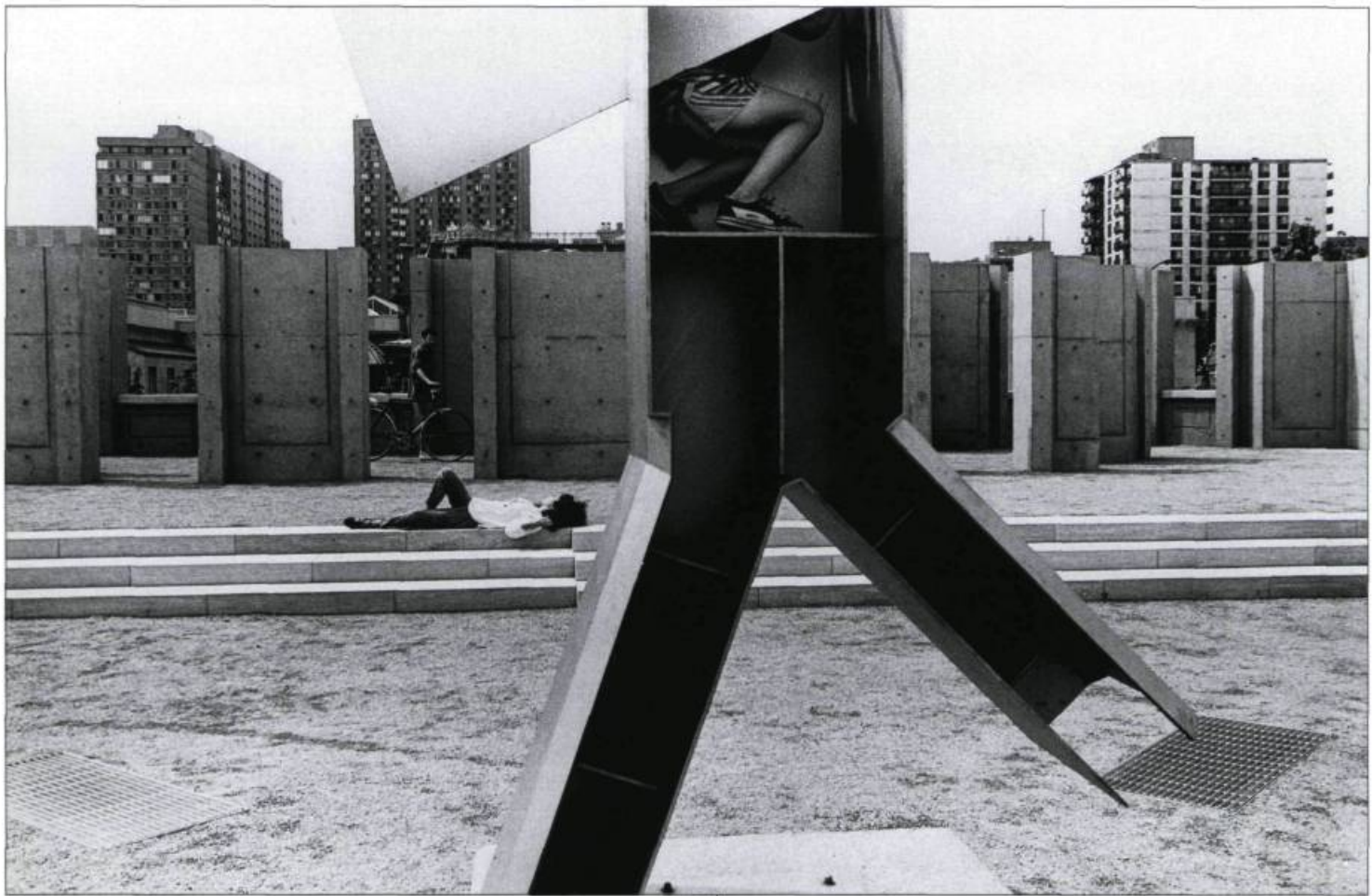
Jardin du Centre Canadien d'Architecture de Melvin Charney. Vue partielle de l'Esplanade montrant Domino dansant , Colonne no. 4 , et L'Arcade . / The Canadian Centre for Architecture Garden by Melvin Charney. Partial View of the Esplanade. Showing Dancing Domino , Column no. 4 , and the Arcade . Montréal, 1990.

interest in the "already" and the "to be made". This place is both.