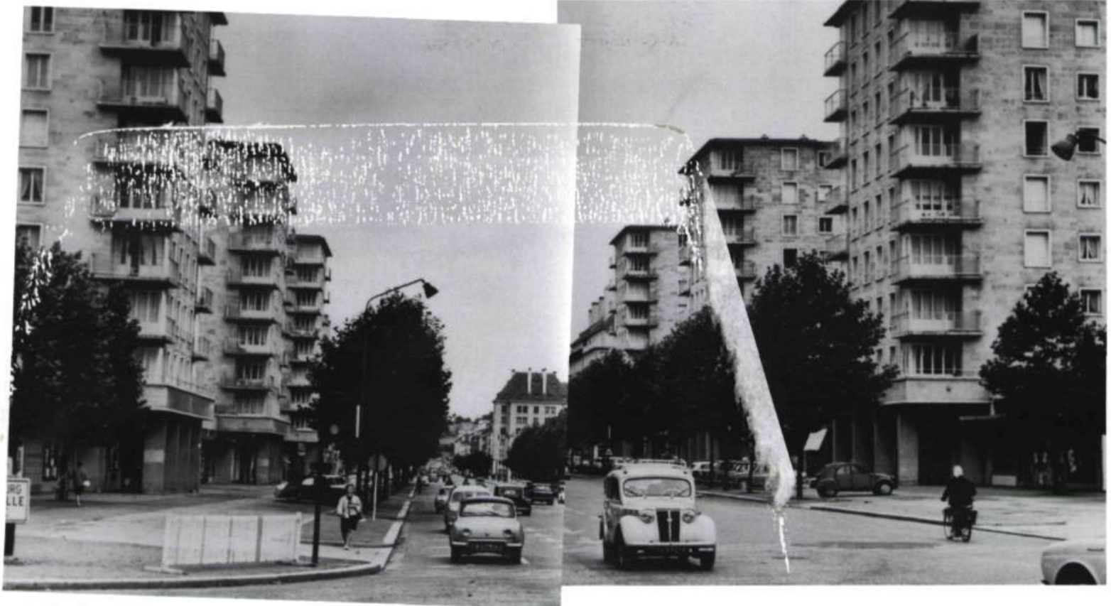
La reconstruction de Caen, 1951-1953, l'avenue du Six-Juin. L'effort d'après-guerre pour reprendre les formations classiques antérieures de la ville.