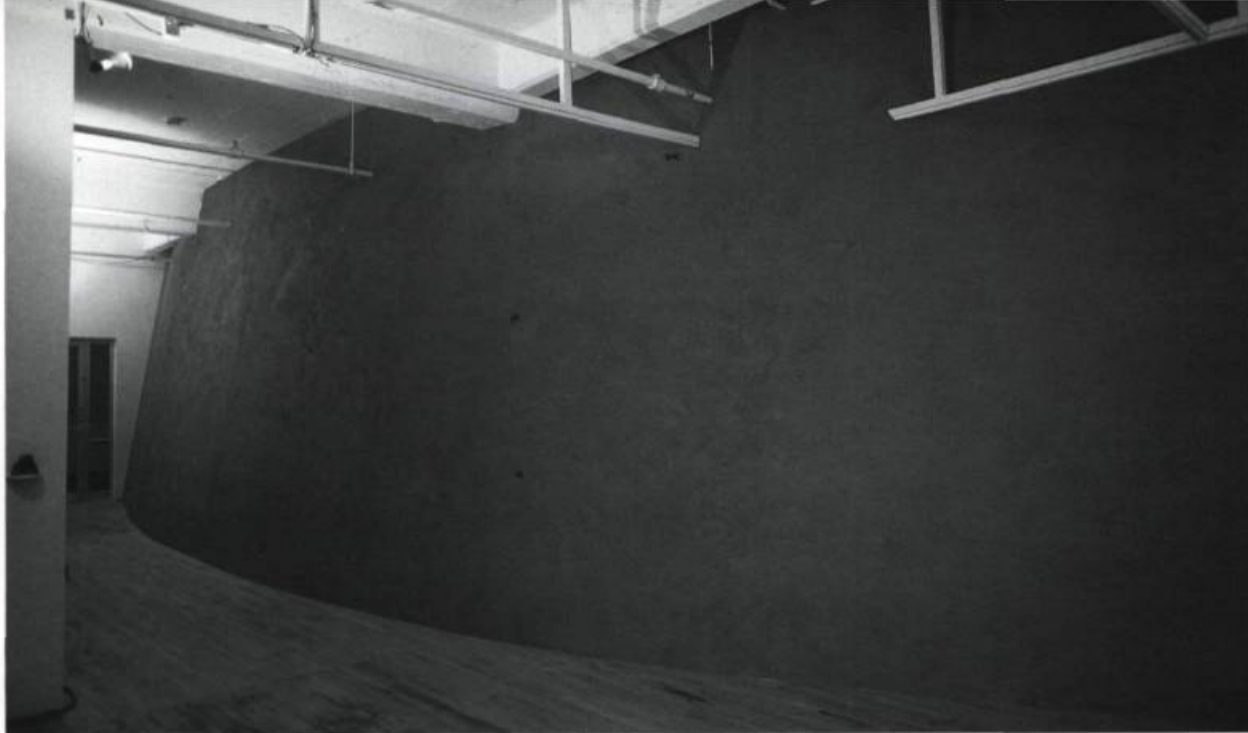
Stéphane Gilot, c'est en suivant la frontière, en longeant la surface (...) , 1997.