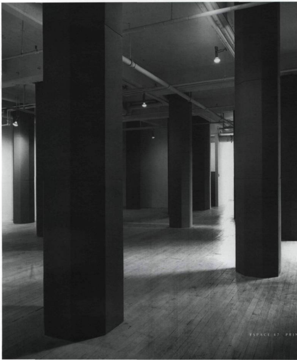
Stéphane Gilot, Le déambuloire , 1998. Vingt-cinq colonnes de différentes épaisseurs, différents tons. Bois, feuilles de plâtre, plâtre, argile, ciment, gouache. 265 m 2 . Galerie Skol, Montréal.