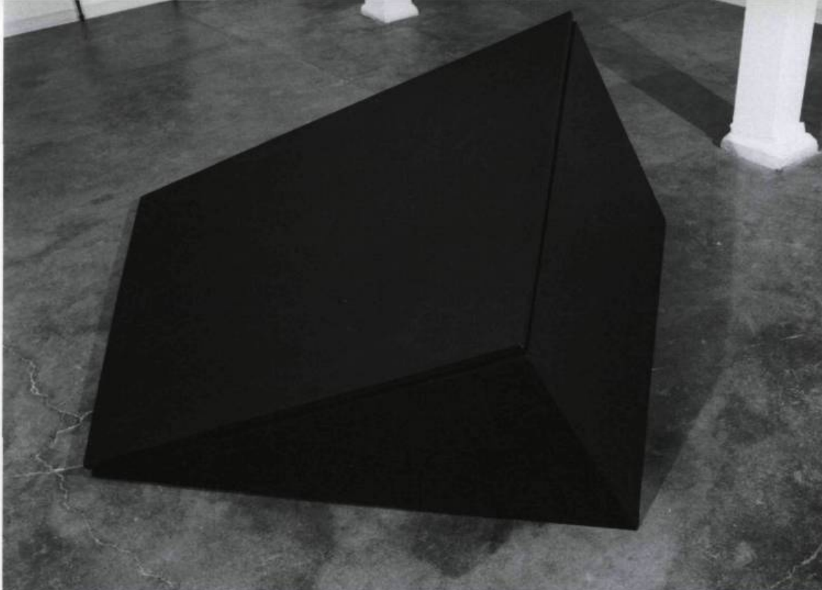
GUIDO MOLINARI, Structure parallélogram- mique , 1972. Exposition: La sculpture fait surface .