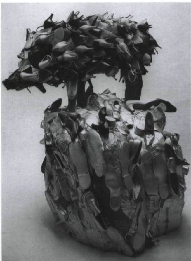
Ken LITTLE, Poke , 1982. Souliers, peinture, papier et structure de bois. 162,6 x 121,9 x 147,3 cm.

J'aime Diogène, enfin, pour ce tonneau montrant à l'envi qu'on peut préférer l'être à l'avoir, la sagesse austère bien que drôle à la possession qui fait des savetiers d'aussi tristes sires que les financiers.