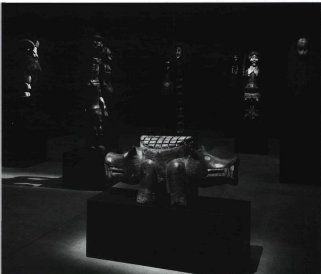
Jake and Dinos CHAPMAN. Installation "Works from the Chapman Family Collection", White Cube, London. 31 October - 7 December 2002. © the artist. Photo: Stephen White. Avec l'aimable autorisation/Courtesy Jay Jopling/White Cube (London).

For Kristeva, these heterogeneous feelings are all provoked by the same confrontation with "... what disturbs identity, system, order... the in-between, the ambiguous, the composite. The traitor, the liar,