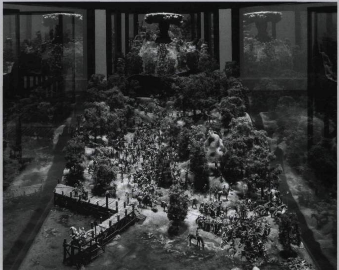
Jake and Dinos CHAPMAN, Hell (détail), 1999-2000.

ality. It would be more accurate to say that in this series, the sculpture oozes abjection from every side and in every direction. In Fuckface Twin of 1995, for example, the artists created a mutant mannequin straight out of a bad erotic science-fiction film—a kind of Siamese twins attached from head to trunk, with two arms and three legs. These Siamese mutants are similar to prepubescent children without genitals but with a nose in the shape of a penis and a mouth in the form of an anus. They are made of Fiberglas and wear a real wig and Nike running shoes. The result is a hyperrealist sculpture of an improbable being. This improbability is not total since the sculpture causes unease rather than simple hilarity. In part, this uneasiness is generated by widespread fear of genetic experiments and stem cell research. The hyperrealist aspect of the modelling and the use of real sports shoes and wig intensify the impression of an almost tangible reality and thus increase the degree of anxiety. In other words, these mannequins have something too human and real about them to be simply ridiculous virtual figures. When there is laughter, it is constrained and anxious