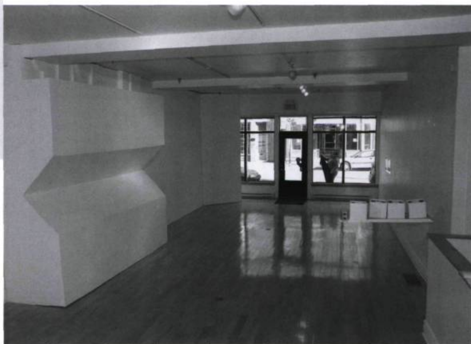
Matthieu HUSSER, Déplacement cartographique , 2007. Vue d'ensemble de l'exposition.

Husser utilise ses maquettes comme un miroir «reformant», visant à réparer les déformations