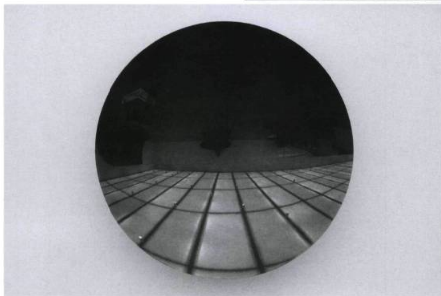
Anish KAPOOR, 1000 Names, 1979-1980. Médiums mixtes et pigment. 159 cm. LeWitt Collection, Chester, CT.