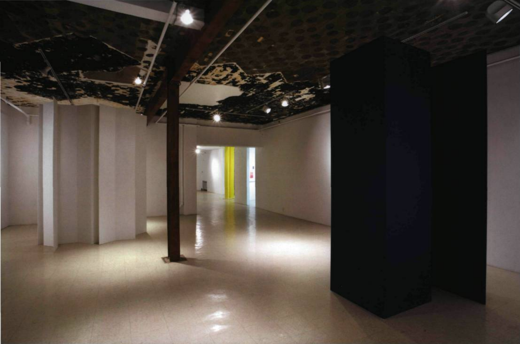
Claude TOUSIGNANT, Modulateur de lumière n° 3, 2001-2003. Aluminium peint. 84.5 x 183 x 62 cm (l'en- semble). Achat, avec l'aide du programme d'Aide aux acqui- sitions du Conseil des Arts du Canada. Collection Musée d'art contemporain de Montréal. A 05 27 5 3.