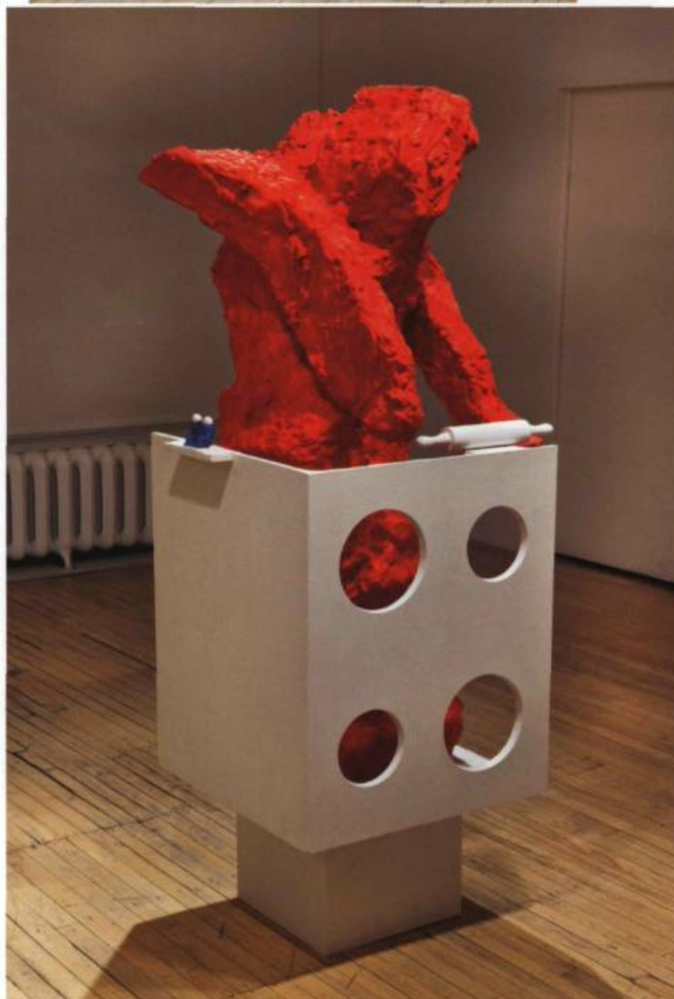
Gilles MIHALCEAN, Fabrication de la tarte aux pommes à l'ancienne près d'Orion , 2009. Plâtre, céramique, peinture. 183 x 76 x 66 cm.