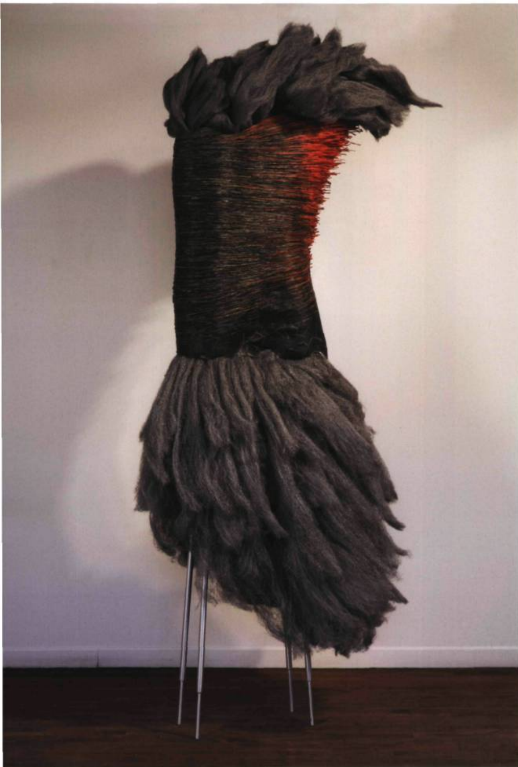
Louise VIGER, Une âme grise (de Samothrace) , 2009. Moulage carton noir, colle menuisier, raphia, encres, laine d'acier, structure tubulaire en aluminium. 213,5 x 91,5 x 30,5 cm.

dans un sous-bois, de deux ou trois de ses modestes « statues » qui savent articuler comme personne les notions de légèreté et de gravité, d'ordre et de désordre, d'étrange et de familier, entre autres, tant dans l'ordre de la sculpture elle-même que dans les autres domaines de la pensée et de la vie. Dommage.