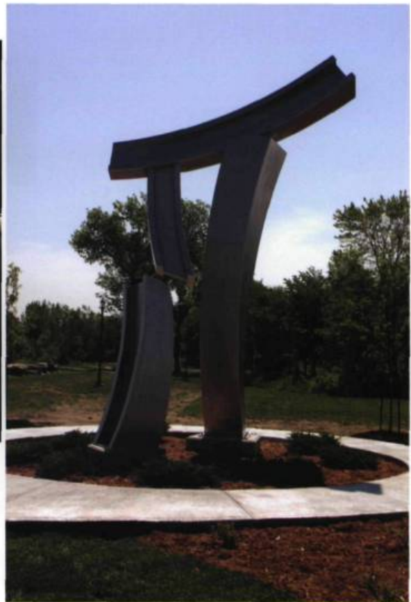
Claude MILLETTE, Le coup de départ , 2009. Acier inoxydable/Stainless steel. Parc Philippe-Laheurte, Saint-Laurent.