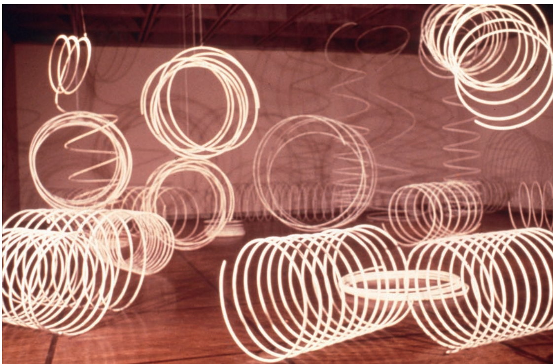
Serge OTIS, Spirales Unlimited , 1969. Détail, installation au MACM. Tiges métalliques. Détruite.

S. Otis disait décapiter simplement certaines de ses fleurs pour ne conserver que des tiges de métal. Il leur donnait un mouvement en spirale pour les transformer en des cercles blancs emboîtés les uns dans les autres. En juillet 1969, l'exposition Spirales Unlimited était présentée au MACM. Des spirales aux dimensions variées étaient disposées dans une grande salle. Les visiteurs pouvaient déformer ou déplacer ces objets sculptés, créant chaque fois une