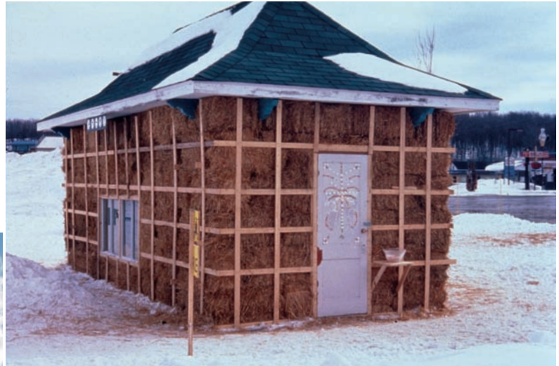
Christopher VARADY-SZABO, Utopie Now , 2004. Place de la gare, Granby. Toit existant, matériaux divers/Existing roof, various materials. 5 x 9,4 x 4 m.

environments can have on ways of thinking about our relationship to the world around us.” 6