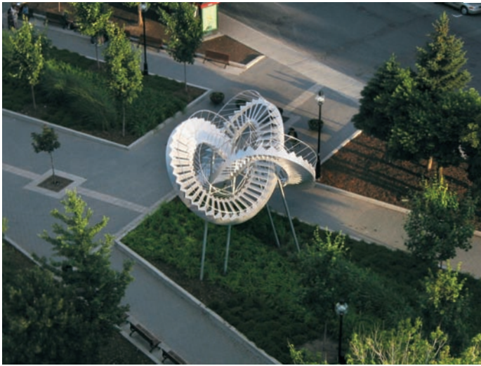
Michel DE BROIN, Révolutions , 2003. Aluminium. 500 x 500 x 850 cm.