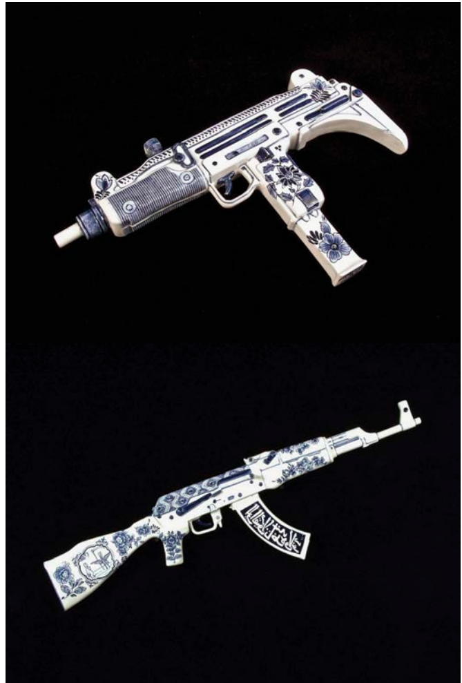
Charles Krafft , haut/top : Porcelain War Museum Project: Large Uzi , 2012. Bas/Below : Porcelain War Museum Project: Saul Steinberg Ak47 , 2013. Pâte de porcelaine molle peinte à la main/Hand painted soft paste porcelain. Grandeur nature/Life-sized.

Là où la sculpture est revisitée, ce n'est pas tant dans l'utilisation à contresens de la pierre, mais bien dans le choix de l'objet à fabriquer. L'industrialisation nord-américaine de la fin du 19 e siècle – concordant avec la révolution militaire qui marque considérablement la technique