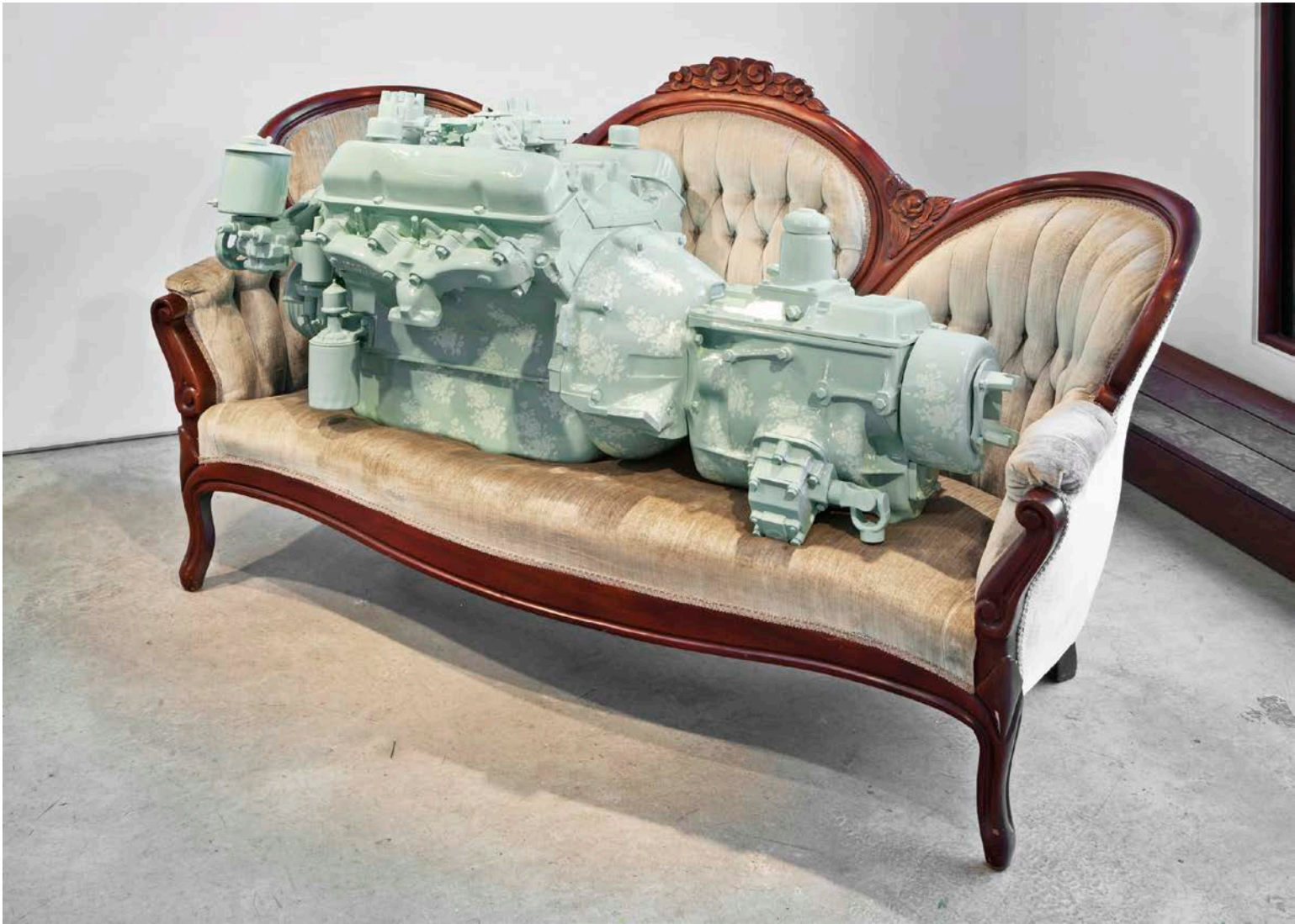
Clint Neufeld, One Yellow Rose , 2012. Céramique, bois, tissu / Ceramic, wood, cloth. 70 x 30 x 40 in.

Although sculpture first was made by shaping stone, it has since been produced in many materials, whether hard or soft, rigid or flexible, and by way of constantly renewed techniques. It is in the apparent porosity of its specificities that sculpture, in its current form, is viewed differently here so as to reflect on how man works material in a socio-political context of conflict. In appropriating the concepts of catastrophe and armed conflict through sculpture today, Ben Jackel, Clint Neufeld and Charles Krafft endow emblematically tough and masculine objects with a fragile quality. The sculptures of these three artists address notions of the machine, catastrophe and war, and are variously comprised of motors, jets, tanks or guns, which have become aestheticized objects stripped of their initial function.