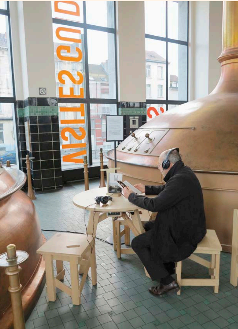
ZimmerFrei, W , installation sonore dans le hall d'entrée du WIELS/sound installation in the Lobby of WIELS, 2013.

accounts BNA-BBOT has collected are archived in a database along with a compilation of sounds of the city. All of these soundtracks are made available to the community, and artists can use them as creative material.