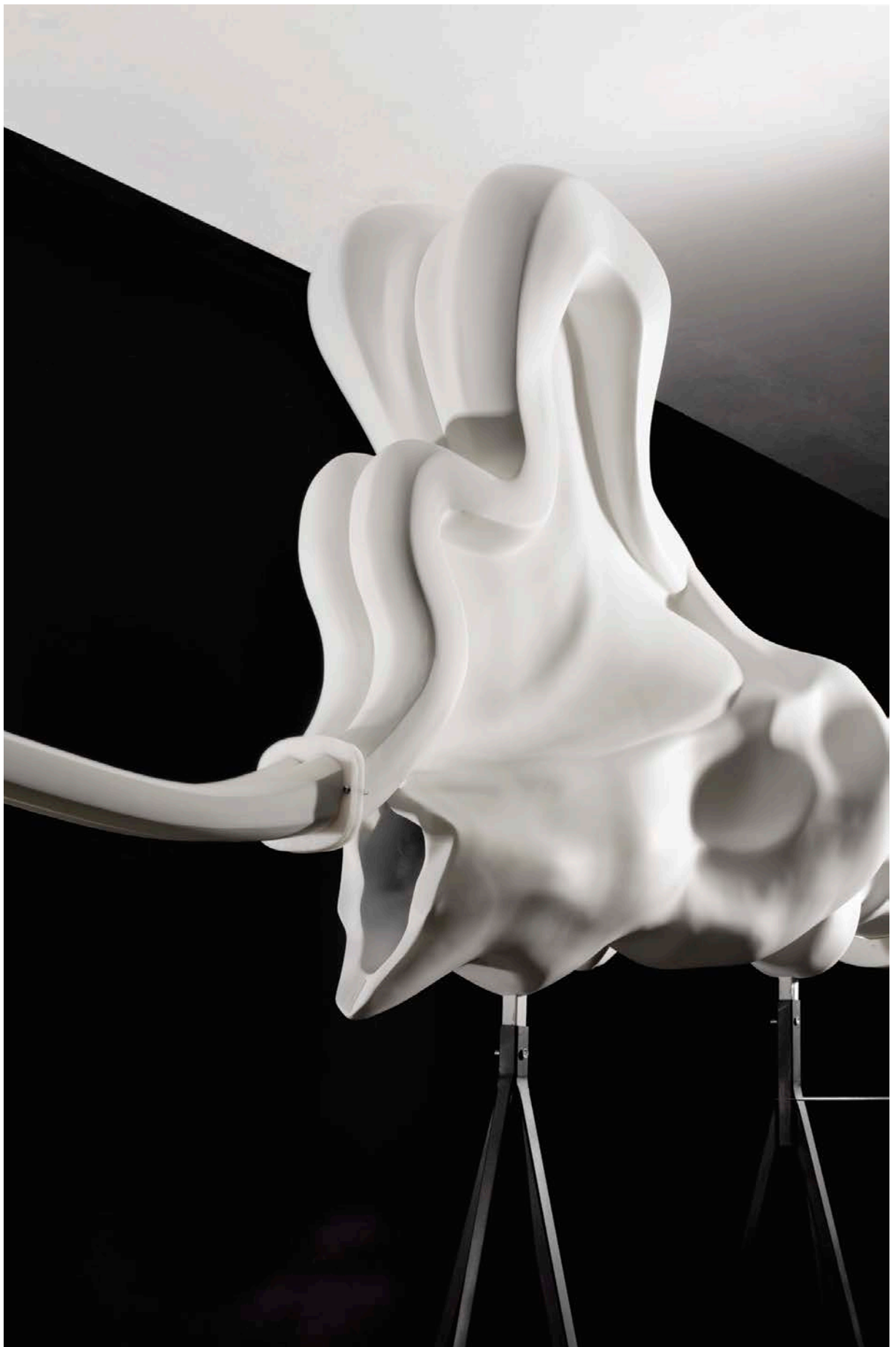
P. 14 : Jon Rafman , New Age Demanded (S-Curve Marble) , 2015. Impression au jet d'encre, qualité archive/Inkjet print, archive quality, 183 x 152 cm, unique.