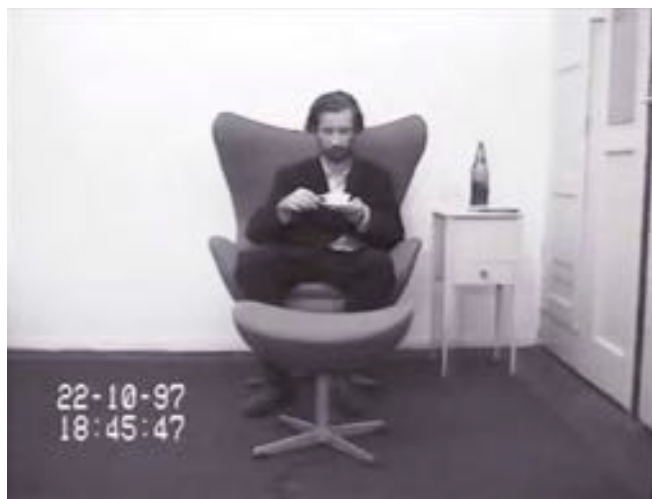
Carsten Höller, Muscimol 3, 1997. VHS, n&b, son, 14 min 8 sec. Image tirée de la vidéo.