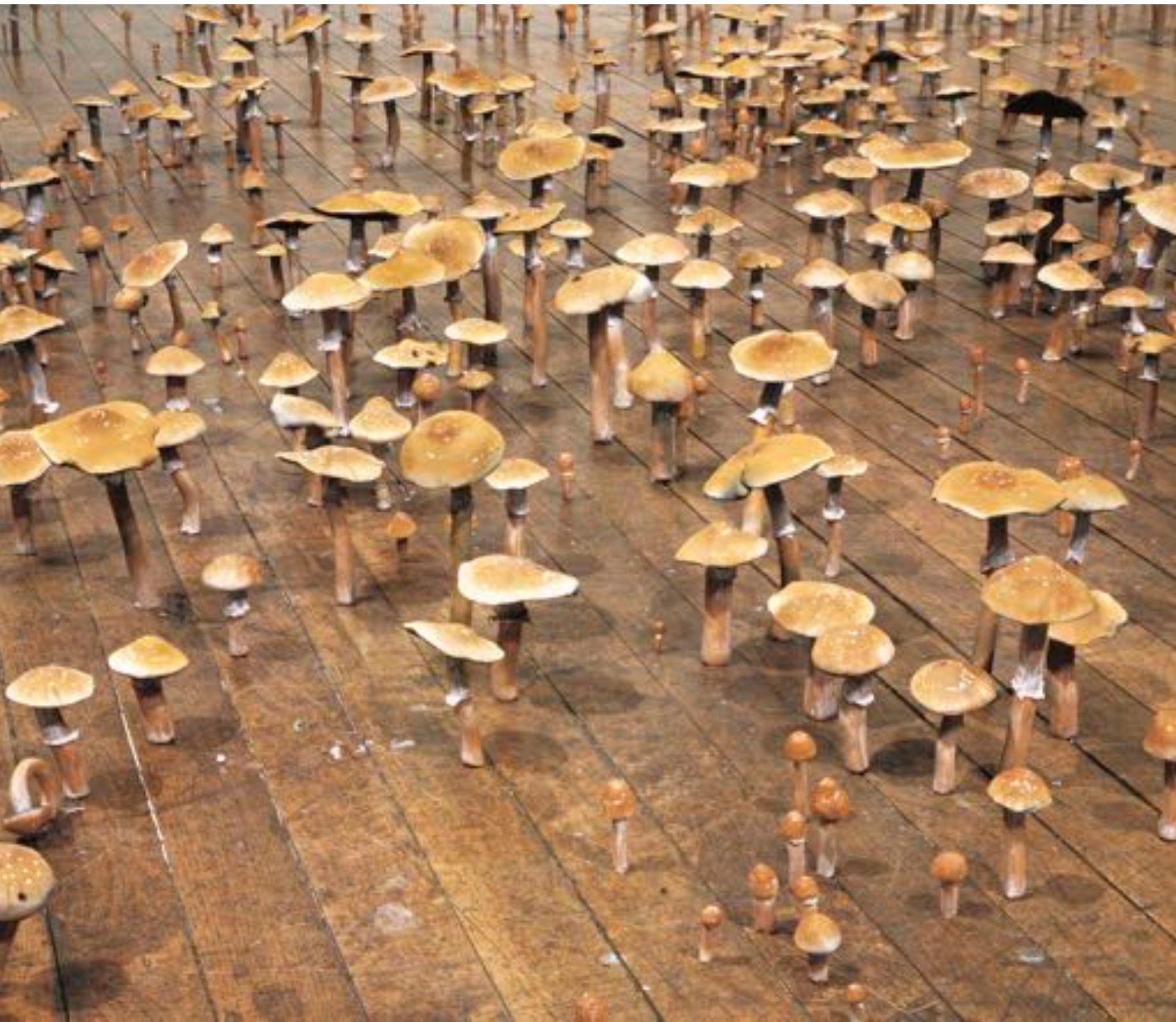
Roxy Paine , Psilocybes Cubensis Field , 1997.