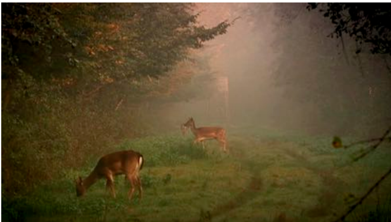
Duke and Battersby , Beauty Plus Pity , 2009. Image tirée de la vidéo, couleur, son, 15 min.

Adopter, ou plus correctement, imaginer, le point de vue d'un animal est souvent une tentative pour saisir l'ineffable – pour réellement connaître l'autre, cette altérité familière de la présence animale dans nos vies. Nous nous efforçons de connaître les autres de façon à surmonter notre isolement fondamental – donner du sens est une façon de s'approprier; après tout, chaque tentative de compréhension s'avère une tentative de communication. Y a-t-il quelqu'un ou quelque chose à l'écoute ?