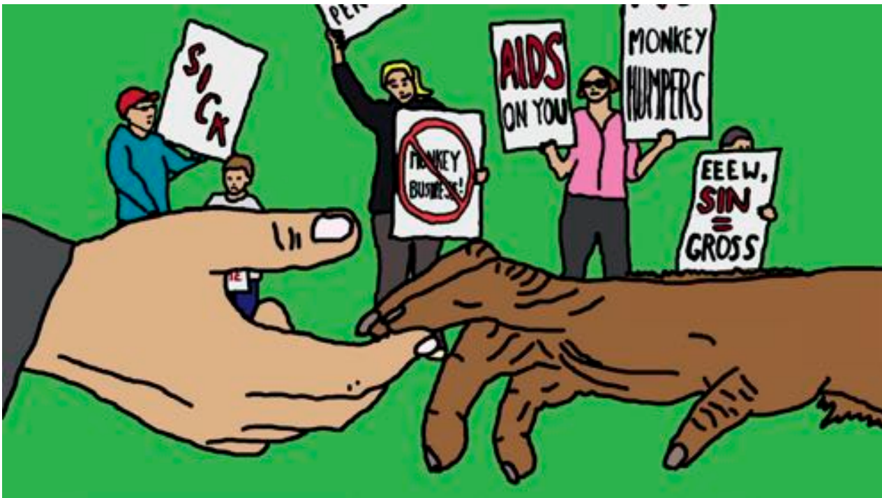
Duke and Battersby, Lesser Apes , 2011. Image tirée de la vidéo, couleur, son, 13 min.

Les relations entre les singes bonobos sont les plus proches des relations humaines, et ceux-ci vivent dans une société matriarcale. Eux aussi, comme Duke et Battersby le mentionnent sur leur site web, « vivent sans conflit et sont sans vergogne sexuelle. » Meema l'est certainement. Elle est une autre messagère du monde animal aux humains, dont l'enthousiasme franc et l'exploration active des concepts humains la distinguent des guides plus avisés qui apparaissent dans les autres vidéos de Duke et Battersby.