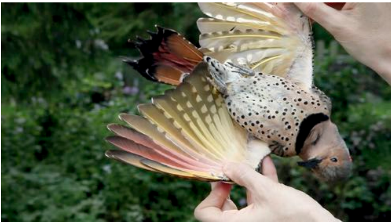
Duke and Battersby, Here Is Everything , 2013. Image tirée de la vidéo, couleur, son, 15 min.

Le plus surprenant dans l'œuvre de Duke et Battersby, ce sont les traits de caractère de Meema. Ce qui semble à première vue être de la naïveté, son ouverture à l'idée de la perversion et la conviction qu'elle peut aider les humains, est rapidement retournée contre nous – son discours nous est si étranger que ce sont nos propres limites qui sont testées; il n'y a aucune incompréhension de sa part. Peut-être que Meema ne juge pas bien les humains, mais ce n'est pas naïvement. Lesser Apes traite essentiellement de l'idée de la perversion – les « autres » comportements que la société humaine trouve inacceptables – alors que du point de vue du primate, c'est exactement le courage d'aller au-delà des normes, qui ouvre la possibilité d'une réelle communication entre les espèces. Du point de vue d'un animal, qu'est-ce qui est interdit? Si l'humain n'est plus au centre, comment « l'altérité » se joue-t-elle dans la sphère élargie des relations? Et est-ce que l'idée de la perversion ouvre des portes, tel que Meema le souhaite?