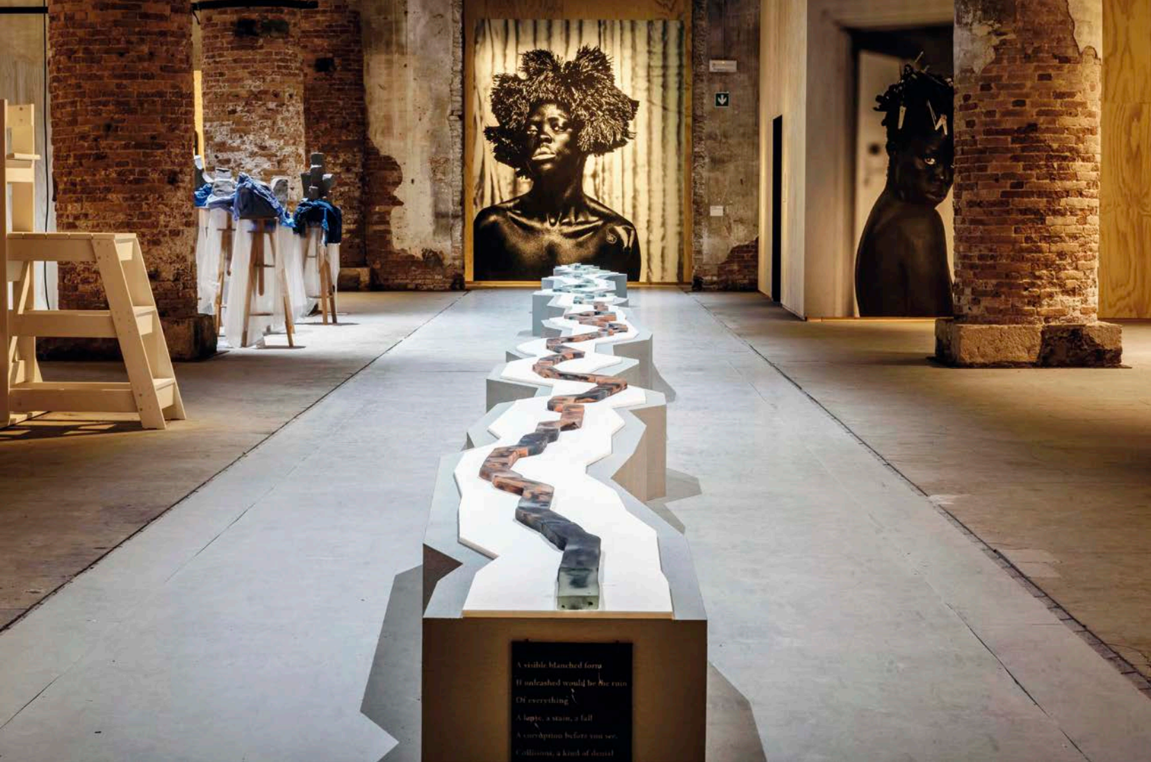
Otobong Nkanga, Veins aligned, 2018. Matériaux mixtes. Arrière-plan : Zanele Muholi, Various works, 2015-2018. Avec l'aimable permission de la Biennale de Venise.

l'État d'Israël. Parallèlement, les images de la série Gates to Heaven (2013) captent des paysages dépouillés mettant en relief une haute et imposante barrière métallique, dont la position stratégique empêche l'accès de certains Palestiniens aux lieux de cultes et brise des habitudes de vies, voire même des relations familiales.