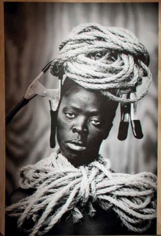
Zanele Muholi, Various works, 2015-2018. Papier peint. Avec l'aimable permission de la Biennale de Venise.

inévitables les idées préconçues de part et d'autre. L'œuvre expose différentes perspectives de la « blanchité » et atteste l'impossibilité d'encapsuler le phénomène. Le racisme systémique y apparaît ainsi dans son irréductible complexité au travers d'une collection d'archives filmiques qui compose, au fil des 50 minutes, un propos critique cohérent et nuancé issu de la longue démarche réflexive de l'artiste.