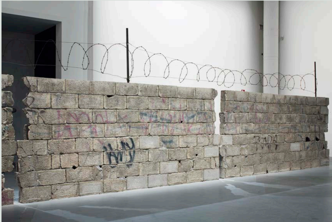
Teresa Margolles , Muro Ciudad Juárez , 2010. Block de béton. Avec l'aimable permission de la Biennale de Venise. Photo : Francesco Galli.