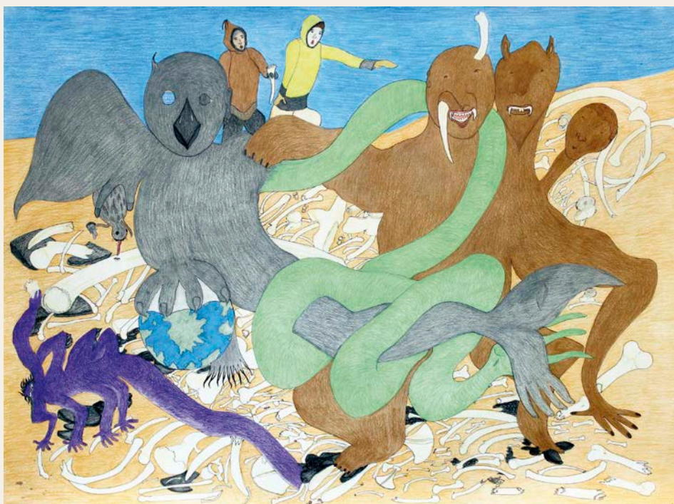
Shuvinaï Ashoona , Imaginary Creatures , 2016. Crayons de couleur, encre sur papier, 91 x 122 cm.

œuvre Historia présentée à la Documenta 14 de Kassel en 2017, consistant en une tapisserie au point d'aiguille presque aussi monumentale que la tapisserie de Bayeux. De même, les dessins de Shuvinaï Ashoona et les photographies de Meryl McMaster investissant le territoire naturel de récits propres à leurs cultures autochtones semblent un peu à l'étroit dans cette mise en exposition. Elles auraient mérité un meilleur recul. Dans une autre salle, Aphélie I de Patrick Bernatchez, articulée autour de l'observation de phénomènes de diffraction des rayons solaires, que l'on avait pu apprécier lors de sa présentation à la galerie Battat Contemporary, paraît cohabiter en tension avec les autres œuvres présentées à grande proximité.