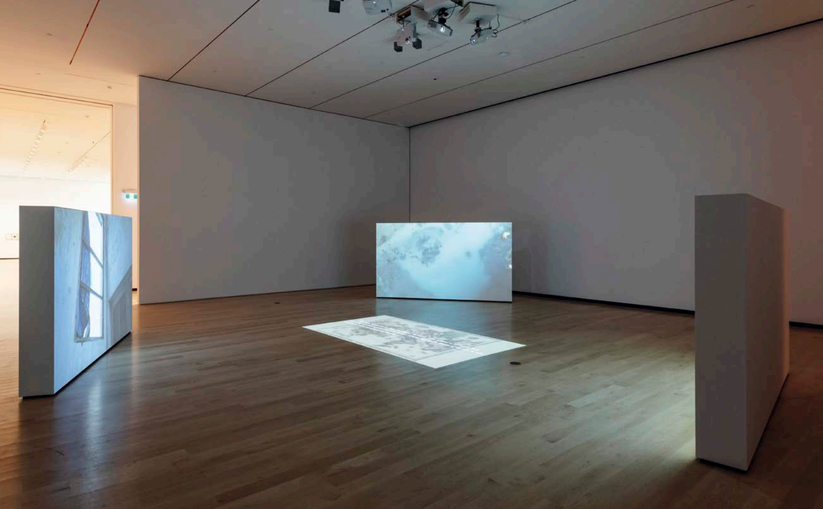
Dinh Q. Lê, The Colony , 2016. Installation vidéo multicanal.

À ce titre, Manif d'art 9 témoigne bien de l'amalgame complexe et des contradictions qui la constitue comme événement, autour d'une proposition muséologique vouée à une certaine représentativité de la scène locale, ainsi qu'à une prolifération de présentations d'artistes internationaux la rapprochant d'un événement éclaté comme une foire en art contemporain. Dans ce contexte, malgré le caractère opaque de certains choix de programmation et la difficulté à relier les œuvres entre elles, l'évènement réussit le pari d'un équilibre délicat et parvient à nous faire découvrir plusieurs artistes étrangers difficiles à apprécier autrement parce que rarement présentés en si grand nombre en même temps. De plus, par son déploiement tentaculaire, il mobilise la communauté artistique d'accueil de manière exemplaire, alors que les collaborations avec une variété de partenaires, le volet dédié à l'art public et celui donnant une visibilité bienvenue à de jeunes commissaires lui assurent un maximum de retombées artistiques et une diversification des expériences de chacun. Reste à voir comment l'évènement et le Musée national des beaux-arts du Québec réussiront à créer des réseaux de collaborations à l'étranger.