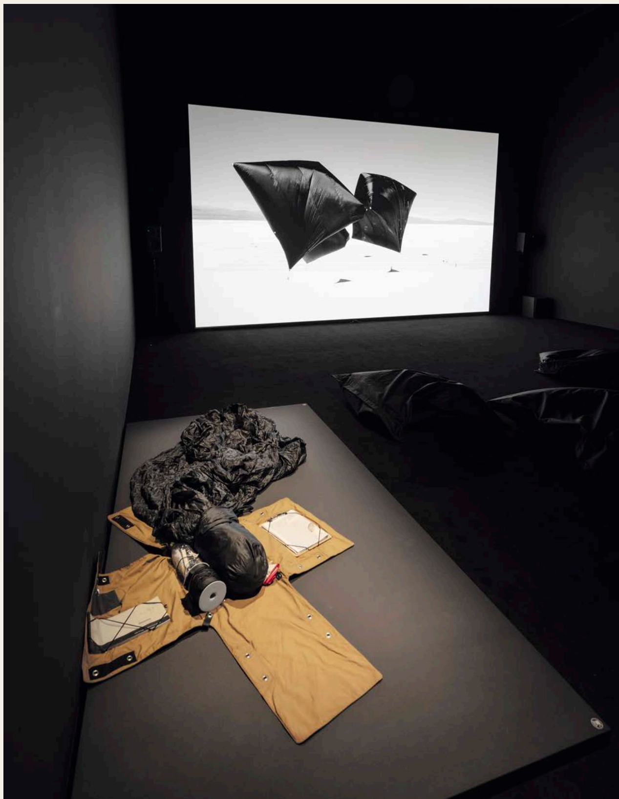
Tomás Saraceno, Aerocene Explorer Backpack Ae101 CC By-Sa 4.0, 2016.