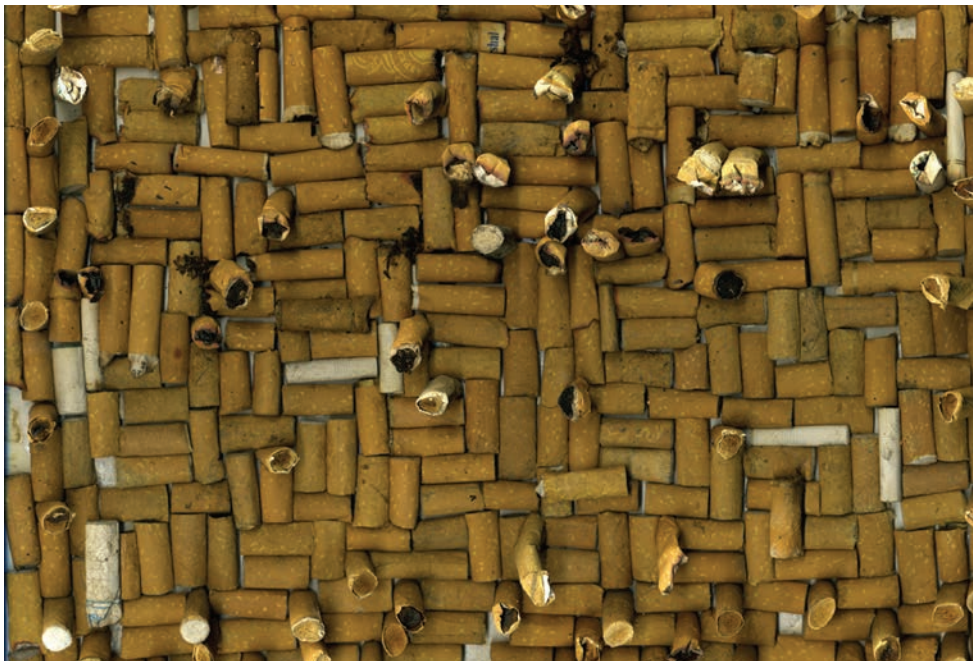
José Antonio Vega Macotela, Time Exchange 148 ( El-superaton ), Time Divisa , 2008.