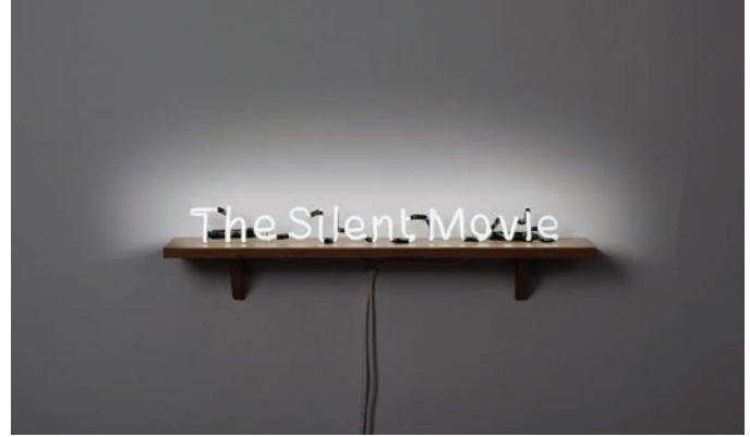
Laurent Grasso, The Silent Movie , 2010. © Laurent Grasso / ADAGP, Paris, 2012 photo : Florian Kleinfenn, permission de la Galerie chez Valentin, Paris