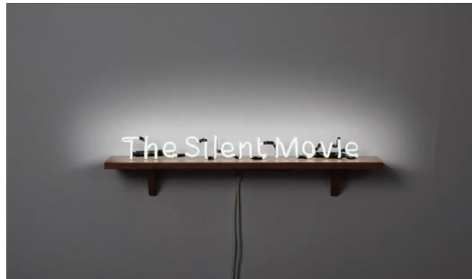
Laurent Grasso, The Silent Movie , 2010. © Laurent Grasso / ADAGP, Paris, 2012