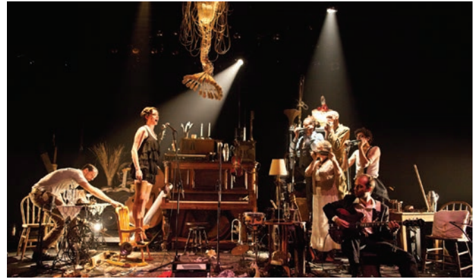
L'Orchestre d'Hommes-Orchestres, Kurt Weill : Cabaret brise-jour et autres manivelles , 2012.