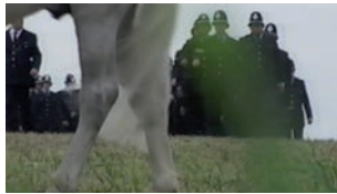
JEREMY DELLER, THE BATTLE OF ORNGRAVE, 17 JUN 2001. PHOTOS: PERMISSION DE L'ARTISTE ET GAVIN BROWN'S ENTERPRISE

Le Pil and Galia Kollektiv entrevoit une manière pour cet échec de l'authenticité de fonctionner du point de vue critique : « Un moment d'histoire n'est jamais neuf, ce qui signifie qu'il n'y a pas d'original à répéter. » Puisant à la notion d'histoire « sans repères ni coordonnées originaires » de Michel Foucault, le collectif pose qu'une reconstitution réussie entraînerait vis-à-vis du point d'origine une déloyauté qui n'est pas un relativisme historique, et qui, en activant plutôt l'histoire à même le présent, nous permettrait d'en finir avec la tentative stérile de passer outre les infinies médiations du spectacle 5 . J'ajouterai à cela qu'une reconstitution qui ne reconnaît pas ces paradoxes se laisse prendre au piège des discours sur l'authenticité et le génie, et s'en remet en défini-