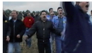
JEREMY DELLER, THE BATTLE OF ORNGRAVE, JUNE 17, 2001.

tive à la notion impossible (quoiqu'obstinément vivace) d'un sens original récupérable et de l'intentionnalité artistique.