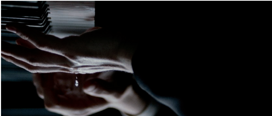
Patrick Bernatchez, 180°, de l'ensemble Lost in Time , 2011.