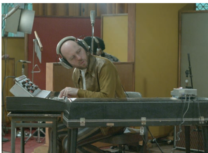
Stan Douglas, Luanda-Kinshasa , captures vidéo | videostills, 2014.

prolific composer, he promotes experimental music produced in a context of free and spontaneous improvisation. As he wrote in 1967, “I am not a professional. My paintings are done by a filmmaker, sculpture by a musician, films by a painter, music by a filmmaker, paintings by a sculptor, sculpture by a filmmaker, films by a musician, music by a sculptor... sometimes they all work together. Also, many of my paintings have been done by a painter, sculpture by a sculptor, films by a filmmaker, music by a musician.” 7 His wish is to orchestrate mediums all of which have specific traits, and to develop variations on themes that fall within a continuous movement in his approach as a whole.