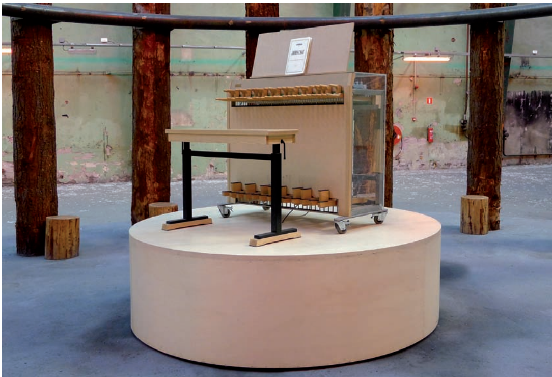
Sarkis, Ballads , vue d'installation | installation view, Submarine Wharf, Rotterdam, 2012. © Sarkis / SODRAC (2014) Photo: Wayne Cullen permission de l'artiste | courtesy of the artist