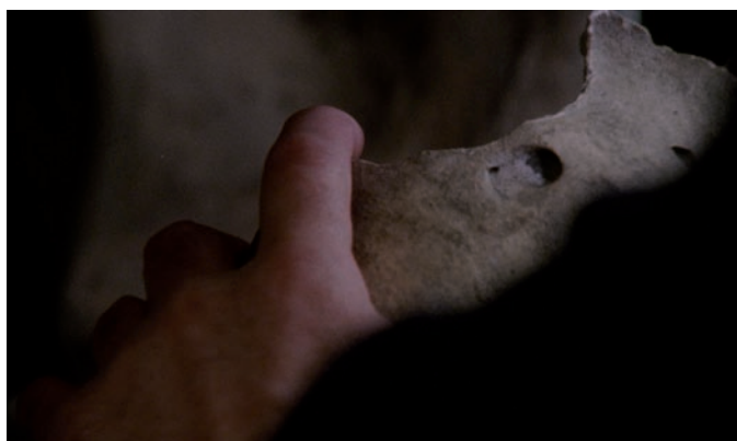
Jennifer Allora et Guillermo Calzadilla, Apotomē , captures vidéo | videostills, 2013.