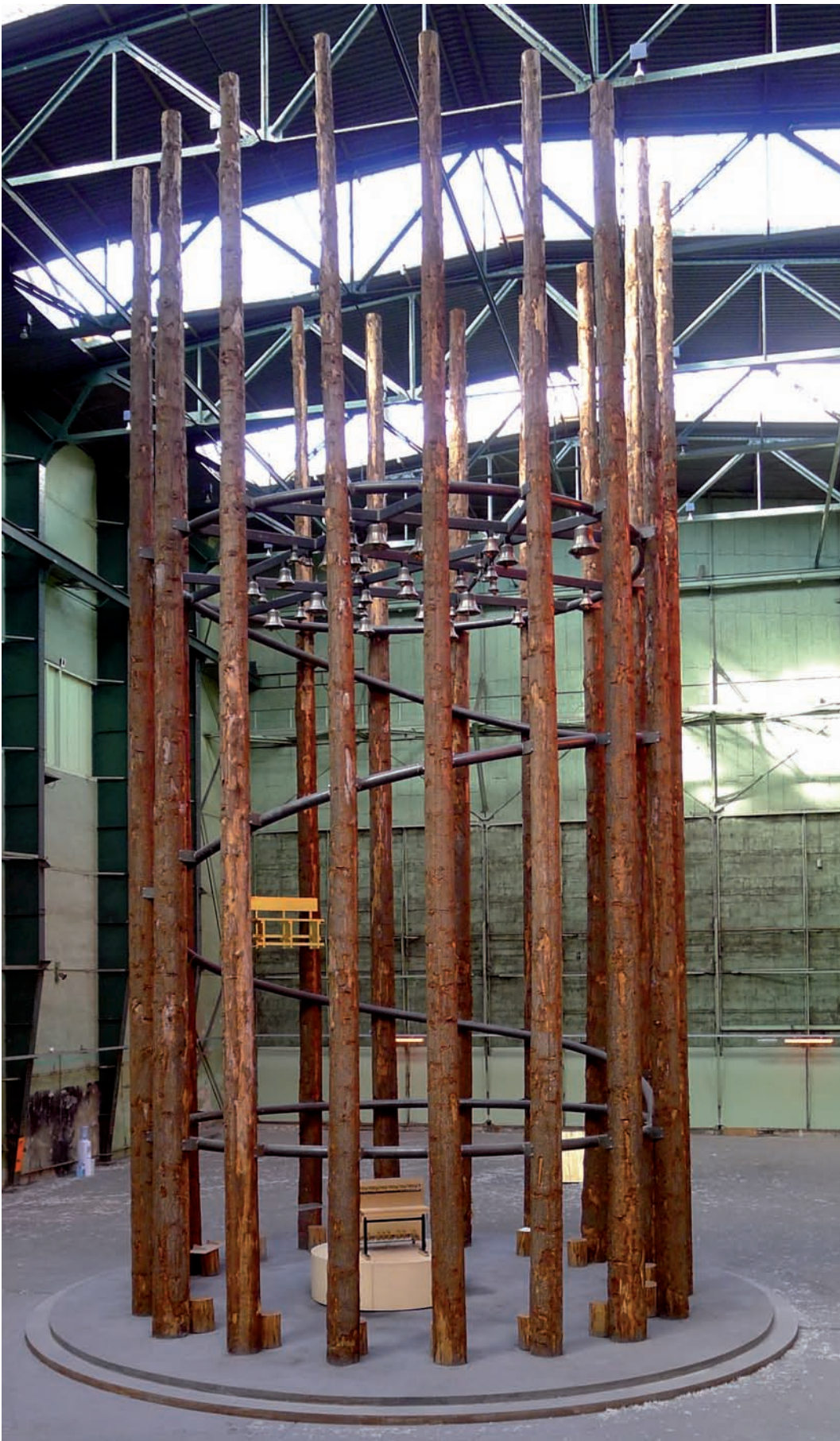
Sarkis, Ballads , vue d'installation | installation view, Submarine Wharf, Rotterdam, 2012. © Sarkis / SODRAC (2014) Photo: Wayne Cullen permission de l'artiste | courtesy of the artist