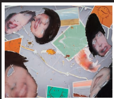
Alexis Lavoie, Remplir le vide (7) / Chaque jour est un jour de fête , 2012.