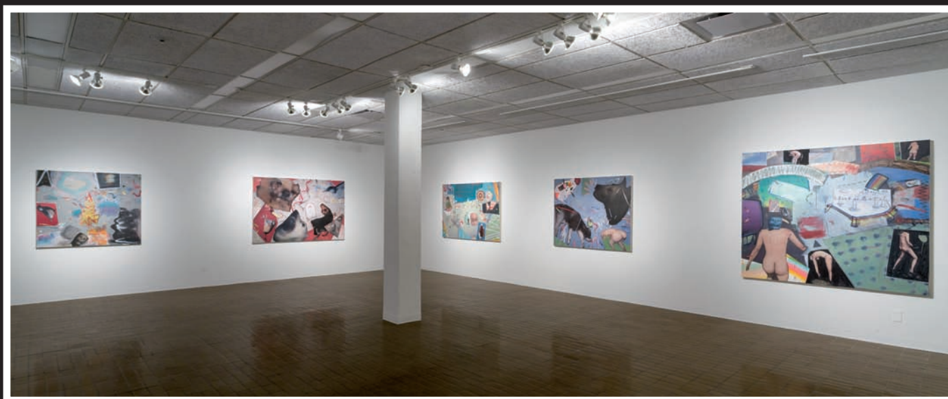
Vue d'exposition, Les yeux crevés , Plein sud, Centre d'exposition en art actuel à Longueuil, 2014.